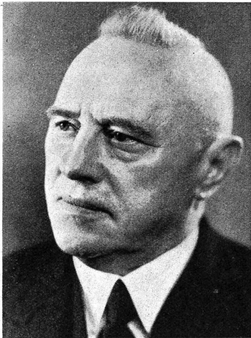
Alt Bundesrat Dr. h. c. Rudolf Minger, Schüpfen