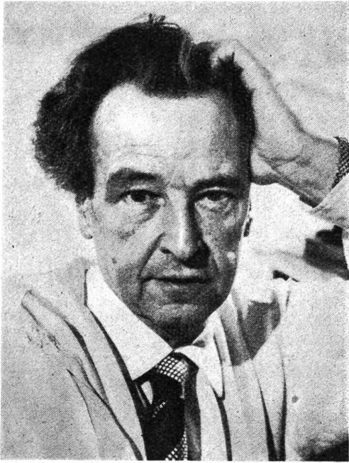
Arthur Honegger, Komponist, Paris