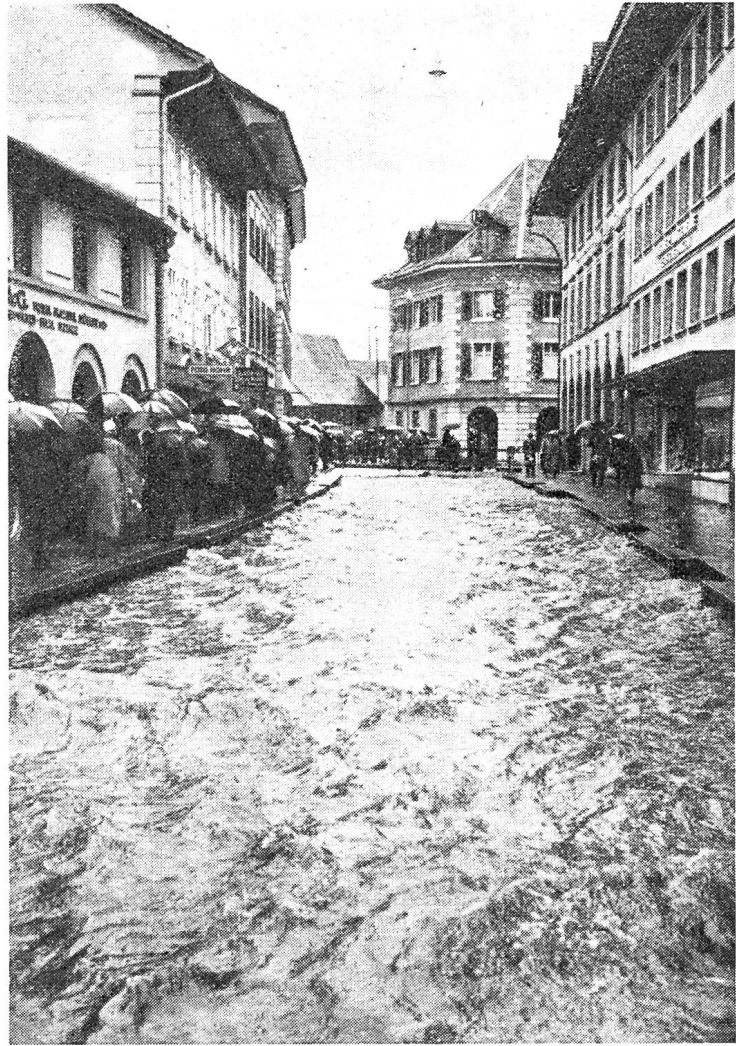
Die andauernden Niederschläge im Februar 1957 führten zu starken Überschwemmungen. Hier die Hochwasser führende Langeten in Langenthal.

Lampenschirmen weg langten sie nach lebendigem Fleisch, nach dem Gastgeber und der Gastgeberin selber. Vom Kopf bis zu den Füßen hatten sie an ihnen alles und jedes auszusehen. Tümpel und Pfützen von Gerede taten sich auf, jeder beugte sich über die Lachen und spuckte seine eigene Weisheit hinein. Obwohl ich, als bestandener Mann und Freund des Hauses, den Gästen Anstand hätte