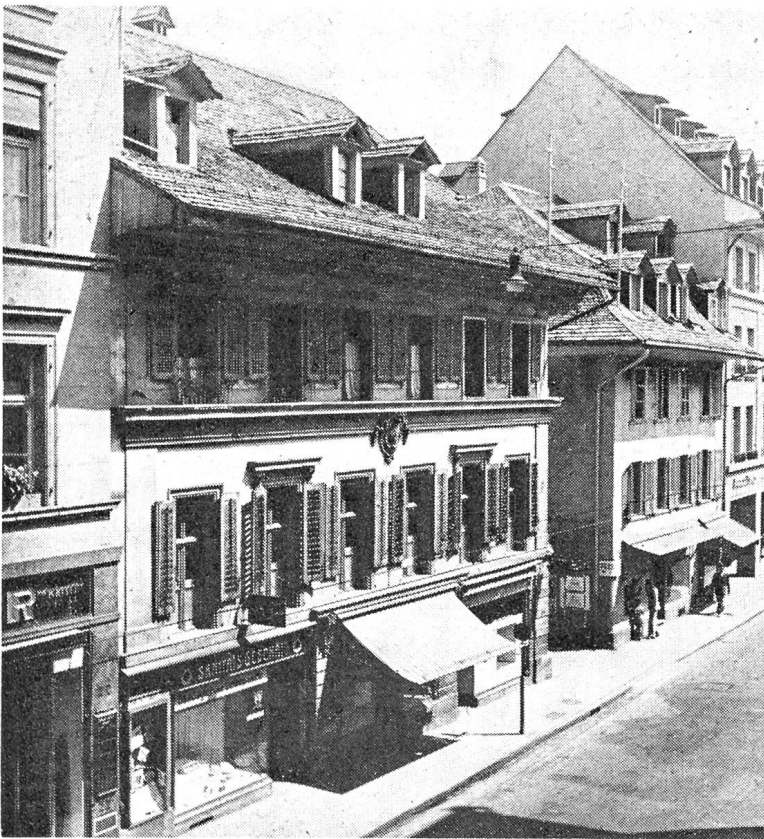
Ein weiterer Zeuge altbernischer Baukunst muß der Bauwit weichen: das aus dem Jahr 1735 stammende Tscharnerhaus an der Anthausgasse.

Der Uhrzeiger mähte die Stunden. Endlich wurde der schwarze Kaffee kredenzt, begleitet von knusprigem Gebäck. Indes die Frauen von den buttergelben Schnitten auf ihre Tellerchen schaufelten, schlückelten die Männer genießerisch