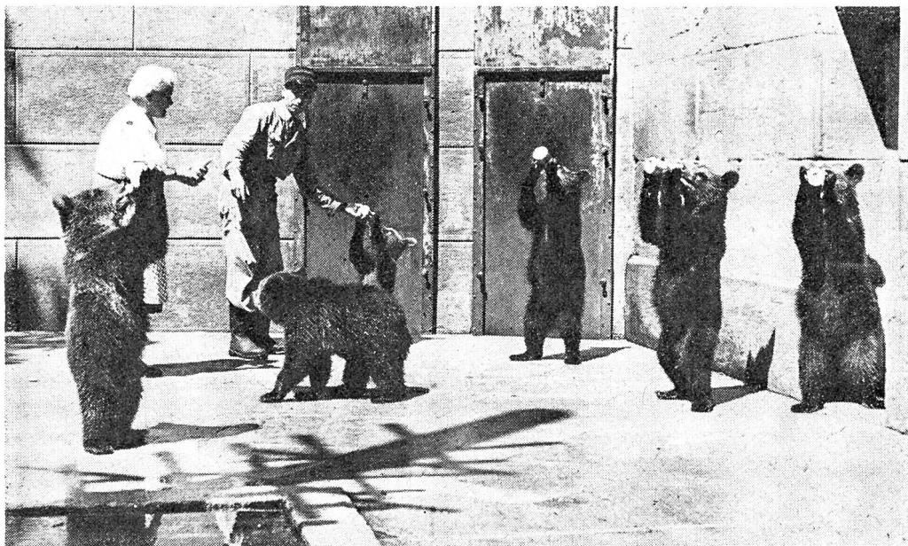
Dem neuen Bärenwärter im Berner Bärengraben gelingt es ausgezeichnet, den Spieltrieb der jungen Bären zu lenken und zu fördern.

„Du wirst uns doch nicht weismachen wollen, du werdest uns niemals nachsehen und verzeihen kön-