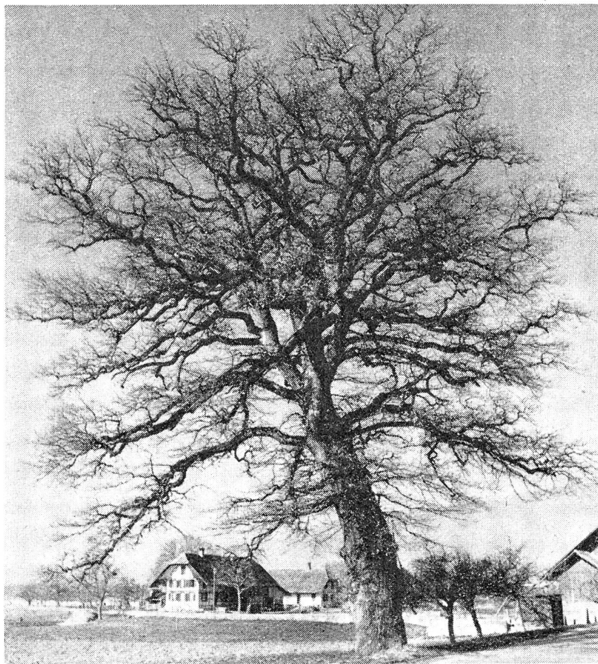
Die „Scheurer-Eiche“ bei Gampelen, ein mehrhundertjähriger prachtvoller Baum, wurde unter Naturschutz gestellt.

Das hinterlistige Gerät spuckte mit einer Behendigkeit und einem Furor, daß man mit keinem Hämmerchen dazwischen geraten wäre, die kantigsten Gesprächsbrocken über die Köpfe hin. Die Gäste wagten einander nicht mehr anzublicken. Sie duckten sich vor Scham, klammerten sich an der Tischkante fest und verkrochen sich in ihre Haut,