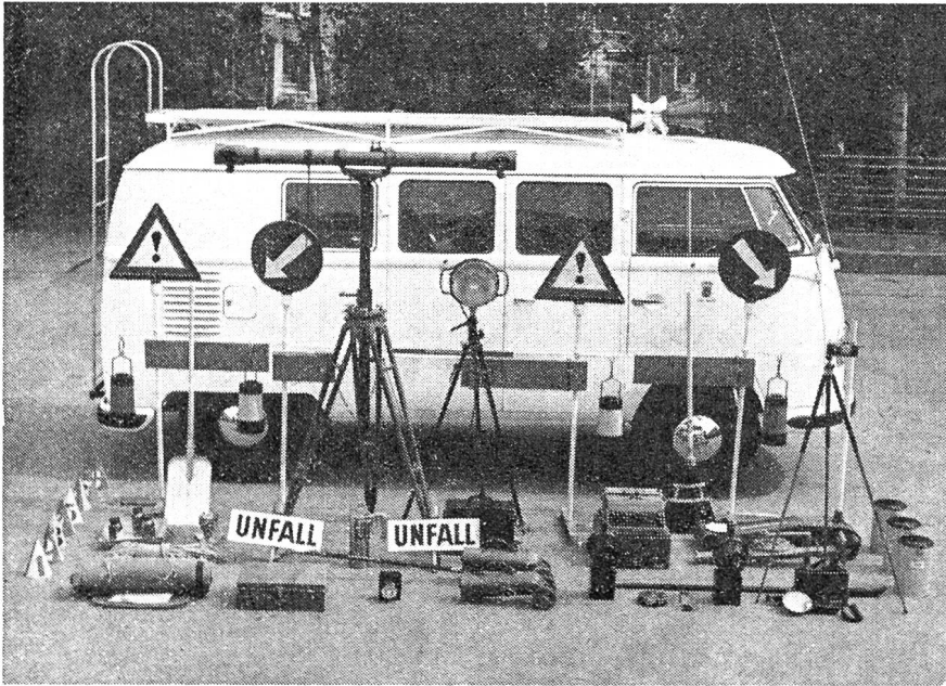
Die Stadtpolizei Bern wurde kürzlich mit diesem modernen Unfallwagen ausgerüstet. Er enthält alles, was für die rasche und exakte Aufnahme von Verkehrsunfällen notwendig ist.

Wir erhoben uns, drückten den Gastgebern die Hand und gingen in die Nacht hinaus, aus einer Stille hinaus in die andere Stille hinein. D. J.