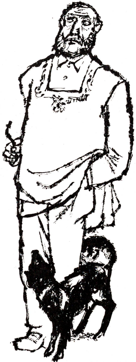
Der Senn mit seinem kleinen schwarz-weißen Appenzellerhund.

„Vermutlich schon. Vorhin duzte das Mädchen den Alten. – Horch!“ Er wies plötzlich mit dem Ellbogen nach dem Fenster, das in seinem Rücken nur angelehnt war. Man vernahm von draußen, wie die zwei Jungen sich verabschiedeten. „Gute Nacht – Großvater. . .“ kam eine klangvolle Mädchenstimme zu uns herein. Kurz darauf nahm man durchs Fenster auch von uns Abschied. „Wir sind