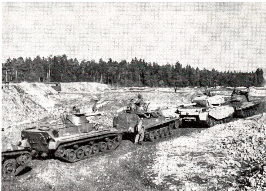
Große Kriegsmaterialschau in Thun im Februar 1961:

Nachher besichtigten wir den Tierpark. Derselbe besteht aus einem Wirtshaus und einem Tierpark. Links rauscht die Mure, rechts das Wirtshaus. Dazwischen liegt die Gartenwirtschaft. Aber der Lehrer sagte, wir werden es schon verklemmen mögen. Der Büffel hat uns nicht am besten gefallen. Affen hatte es keine. Wir waren die einzigen, die nicht ins Wirtshaus gingen. Es befindet sich im ersten Stock.