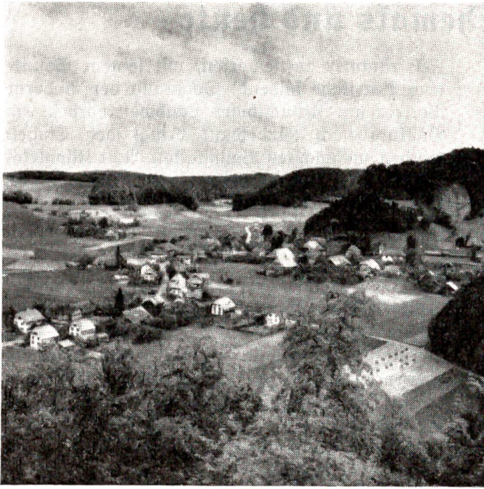
Krauchthal von Thorberg aus gesehen