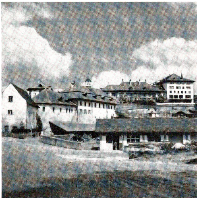
Thorberg: Heutiger Zustand

Hauptmann. Der Konflikt zwischen Habsburg und den Eidgenossen, der sich 1386 im Sempacher Krieg entladen sollte, zog natürlich auch Peter in Mitleidenschaft. So marschierten die Luzerner mit waldstädtischem Zuzug vor Wolhusen und zerstörten die Feste „bis auf den Grund“, und bald brachen die Berner nach Thorberg auf, und Justinger berichtet in seiner trockenen Art: „gewun-