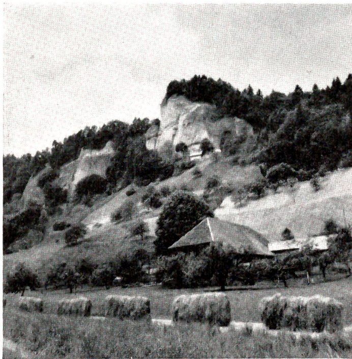
Im Krauchthal: Unter der Sandsteinfluh im Hintergrund erkennt man die heute noch bewohnten Höhlenwohnungen.

Wie es sich nun im einzelnen zutrug, daß da mitten im „friedenden Tal“, nämlich dort, wo seine beiden südlichen Ausläufer sich vergabeln, ein Dorf erwuchs, entzieht sich genauerer Kenntnis.