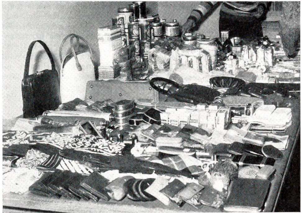
Alle diese Dinge hat eine krankhafte Diebin in Bern in relativ kurzer Zeit aus allen möglichen Läden zusammengestohlen.

Sachmann. Der sechsjährige Sohn eines Theaterdirektors muß zum erstenmal in die Schule. Wie er wieder nach Hause kommt, wird er gefragt, wie es ihm gefallen habe. Es hatte ihm gut gefallen. Und wo er denn sitze? – „Zweite Reihe Parkett!“