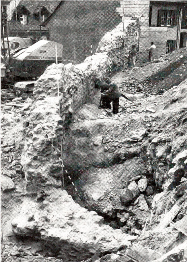
Die Ringmauer der Burg Nydegg

Großvaters Bella warf noch viele Wellen, und ich sehe sie noch immer gern. Nur meine Frau hat nicht mehr viel für sie übrig, seit wir Kinder haben. Sie ist