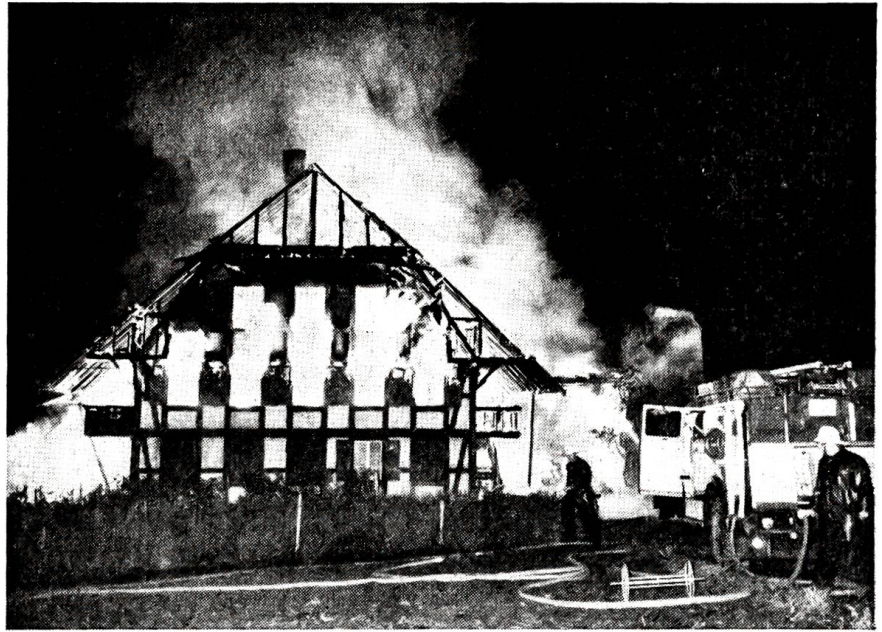
Brand in der Gmatt bei Bern im Mai 1964. Das Wohnhaus konnte nicht mehr gerettet werden.

„Nein. Es hat einer mehr geboten“, erklärt der Martin möglichst gleichgültig. Der alte Propst bietet 1070 zum letzten. Martin aber lehnt ab, beharrlich, unerschütterlich. „Da gibt es kein Feilschen“, knurrt er. „So behalt deine Ziege!“ krächzt der Händler höhnisch, wackelt und flucht davon.