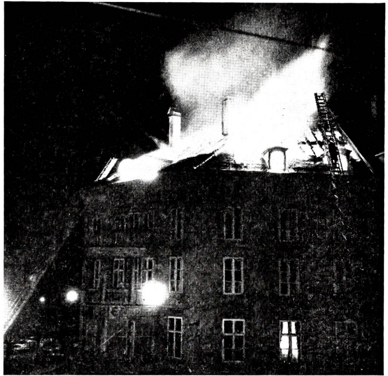
Nächtlicher Großbrand in Bern im bekannten Café Rudolf. Der Brand forderte leider ein Todesopfer und eine Schwerverletzte.