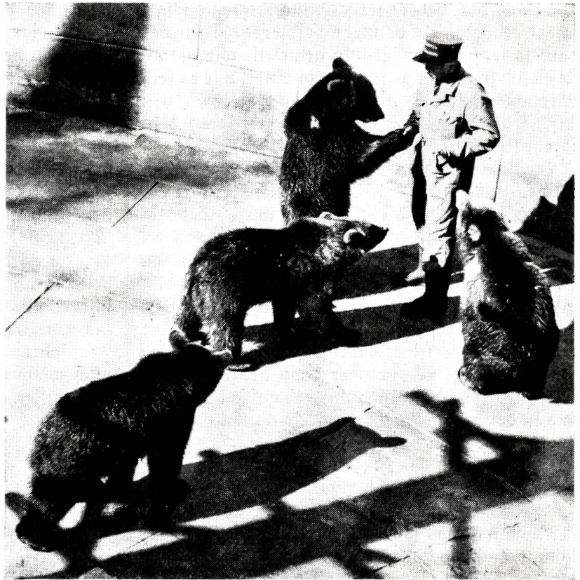
Abschied von ihrem Herrn und Meister nehmen hier die vier 16 Monate alten Bären, die von der Stadt Bern der Expo geschenkt worden sind.

„Herzlich gern, wenn es mir möglich wäre“, hatte der Chef darauf bedauernd gesagt, „aber leider ist Ihr Wagen an einen anderen Fahrer vergeben. Wir haben momentan keinen Wagen frei. Sie könnten höchstens hier auf dem Autohof bei uns arbeiten. Wenigstens momentan. Allerdings dann ohne Tagesspesen, doch zu dem üblichen Gehalt ...“