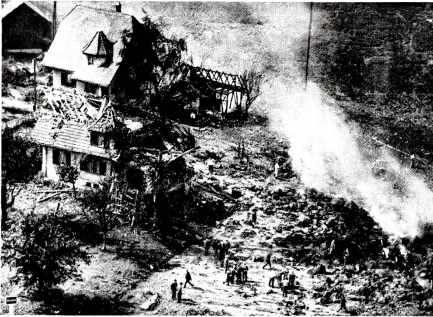
Der Absturz einer Swissair-Caravelle bei Dürrenäsch Die Maschine brannte bereits in der Luft und bohrte sich beim Absturz fast 10 Meter tief in den Ackerboden. In der Bildhälfte links die drei durch die Explosion schwer beschädigten Häuser.