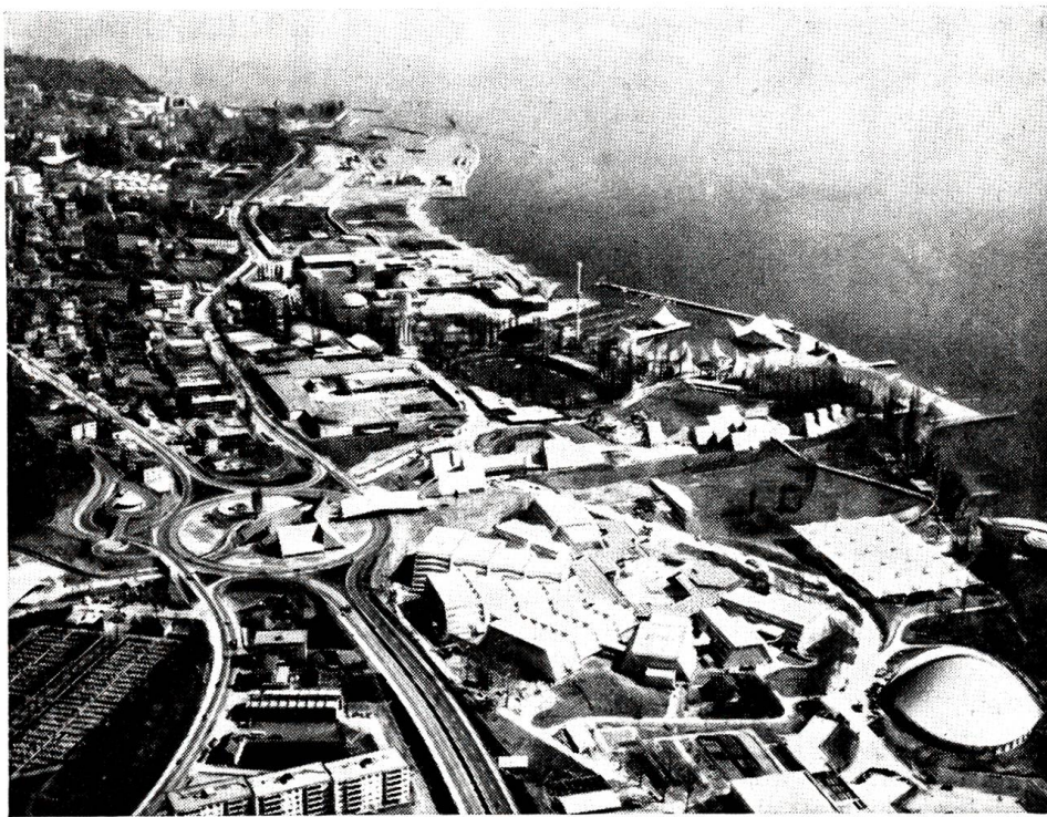
EXPO 1964 Ein Blick auf die reichgegliederte Ausstellung am Ufer des Genfersees

peinlich wirkte nach dem nicht allzu bescheidenen Auftreten der Raffineries im Laufe der Vorgeschichte ihrer Errichtung, daß sie sich kurz nach der Eröffnung, bereits im Mai 1964, mit der Klage an den Bundesrat wendeten, die böse Konkurrenz drohe ihr durch allzu billige Preise den Hals abzuschneiden. Ob der etwas mißglückte Start der Raffineries du Rhône seine Auswirkungen auf andere Projekte für Raffinerien in der Schweiz haben wird, ist zurzeit noch ungewiß. – Am 29. April 1964 öffnete nach jahrelanger Bauzeit die EXPO 64, die Schweizerische Landesausstellung in Lausanne, ihre Pforten. Viel Skepsis war ihr vorausgegangen, viel Optimismus wurde zur Schau gestellt und viel Geld investiert und als Defizitgarantie auf die Seite gelegt. Erfreulicherweise lauten die ersten Berichte über die Ausstellung positiv. Richtigerweise haben die Organisatoren nicht versucht, den wohl einmaligen und nur aus der damaligen Zeit verständlichen Erfolg der Landesausstellung von 1939 in Zürich zu kopie-