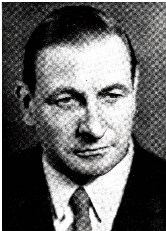
Ludwig von Moos Bundespräsident für das Jahr 1964

ttober 1963 konnte deren Zuteilung an die Truppe gemeldet werden. Trotz seiner 74 Jahre überstand der Präsident im Frühjahr 1964 eine Operation in kürzester Zeit; und selbst während der Dauer seines Spitalaufenthaltes ließ er nicht zu, daß ihn ein Stellvertreter mit einiger Kompetenz ver-