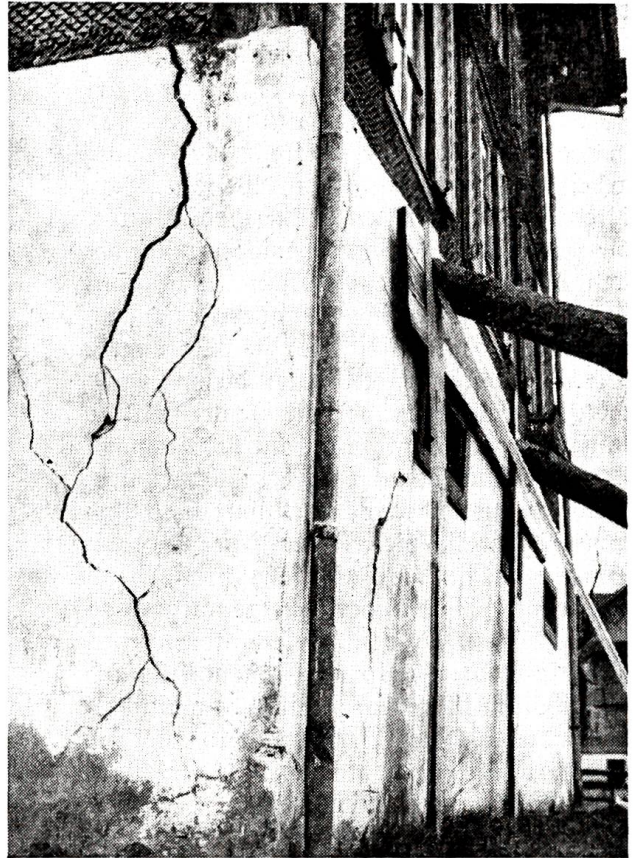
Wiederholte Erdstöße erschütterten im Frühjahr 1964 die Inner- und Ober- und Ners.

Nun aber genug der bitteren Worte und der Kritik. Fast könnte man sonst meinen, es stünde schlimm um unsern Staat. Das stimmt nun auch wieder nicht. Wir wollen nicht übersehen, daß die gegenwärtigen Konjunkturverhältnisse einem sehr hohen Prozentsatz von Leuten in der Schweiz sicheres und gutes Einkommen und im allgemeinen ein sorgenfreies Leben ermöglichen. Einen beträchtlichen Schritt nach vorn bedeutete auch die sechste AHV-Revision, die eine Erhöhung der Renten um fast einen Drittel brachte. Wenn man das heutige Sozialwerk mit dem ursprünglichen aus dem Jahre 1948 vergleicht, so darf man wohl von einem erheblichen Fortschritt sprechen. – Zu den erfreulichen Meldungen darf man auch zählen, daß am 11. Januar 1964 das Eidgenössische Veterinäramt mitteilen konnte, der gesamte Viehbestand der Schweiz sei heute praktisch frei von Bangscher Krankheit. Nachdem schon früher dieselbe Meldung in bezug auf die Tuberkulose hatte erstattet werden können, darf man füglich von einem Erfolg der Landwirtschaftspolitik sprechen. – Nachdem letztes Jahr die betrübliche Affäre der Typhusepidemie in Zermatt erwähnt werden mußte, ist es heute angenehme Pflicht, den definitiven Abschluß der Wiedergutmachungsaktion melden zu können. Die Behörden von Zermatt haben alles ihnen Mögliche getan, um die Trinkwasser- und Abwasserhältnisse zu sanieren. Sie haben aber