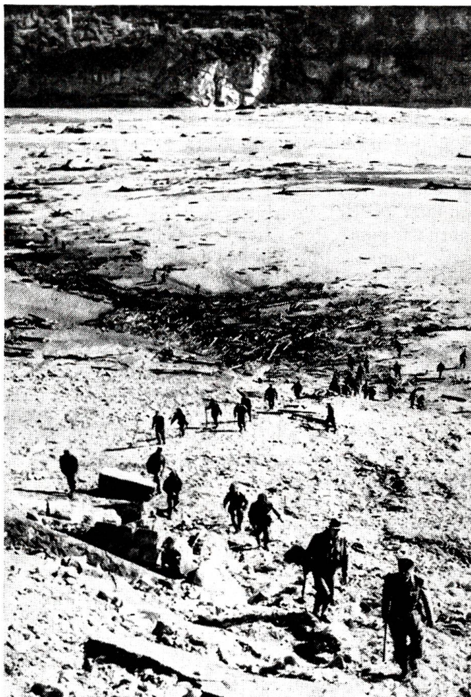
Die Baiont-Katastrophe Unser Bild zeigt die völlig verwüstete Talsohle bei Longarone unterhalb des Staudammes. Im Vordergrund italienische Trup- pen, die die Trümmer nach Vermissten absuchen.