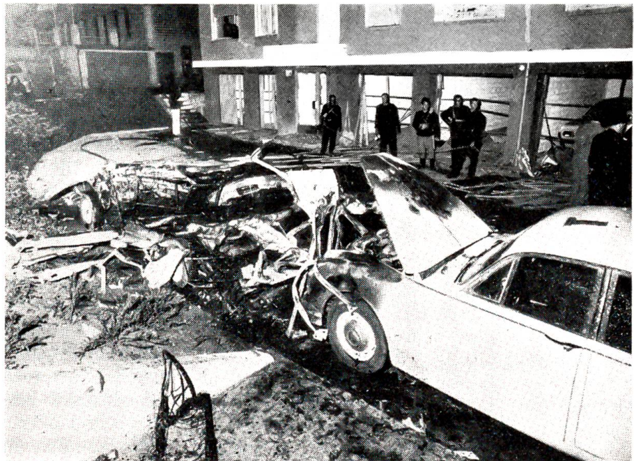
Rätselhafte Explosion in Wabern

Das Steffi spürte ein Würgen im Hals. Lange schaute es nachdenklich in sein schmales Gesicht. Vielleicht sehen wir uns noch einmal, wenn wir fünfzig oder sechzig oder gar siebzig sind, dachte