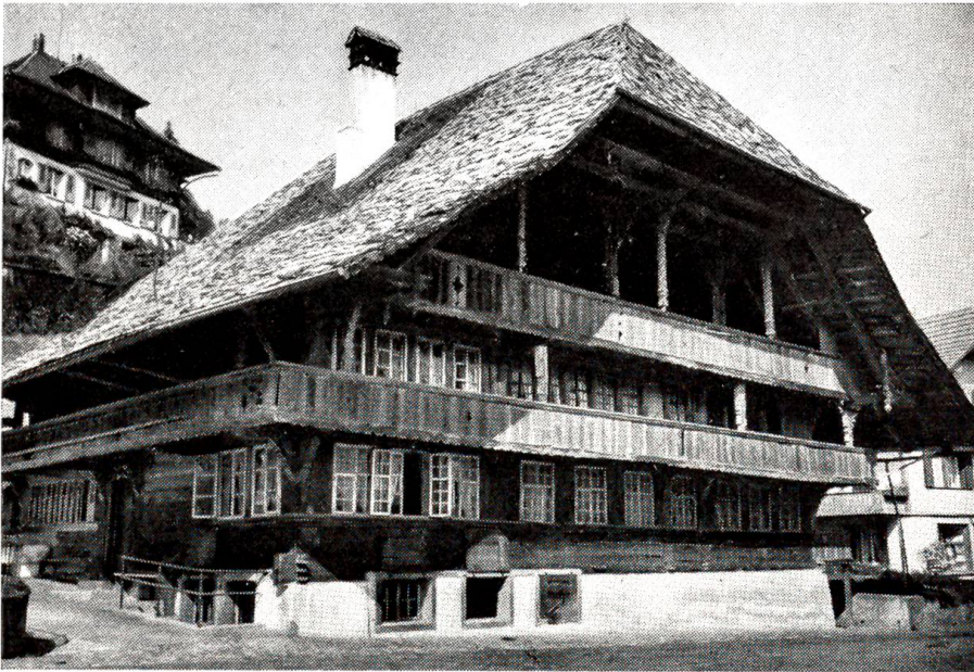
Das 260 Jahre alte «Moserhaus» in Signau wird durch den bernischen Heimatschutz renoviert.