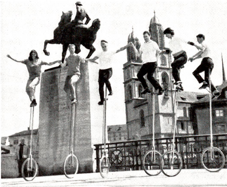
Nur für Schwindelfreie

«Sind Sie fertig? – Mich verlangt nach frischer Luft.»