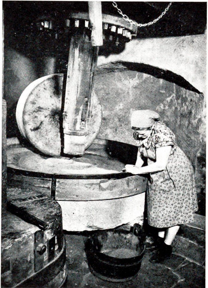
Diese alte Ölmühle in Böttstein AG war bis vor fünf Jahren noch in Betrieb. Die Fett- und Ölwerke Sais in Steffisburg kauften sie zur Feier ihres 50jährigen Bestehens und übergaben sie der Historischen Vereinigung des Bezirks Zurzach als Geschenk.

«Nicht ich... au! Tante Vreni, sicher nicht ich...»