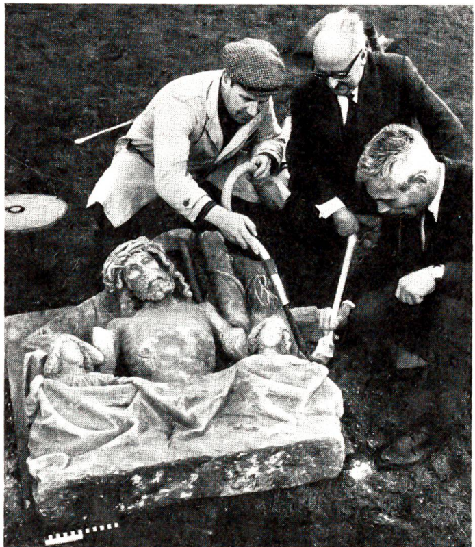
Überraschender Fund in Thorberg

Da lief der Geistliche, so rasch er konnte, zur nächsten Telegraphenstation, nahm Verbindung auf mit Klagenfurt, Graz und Wien, ruhte nicht, bis er einen Strafaufschub erwirkt hatte, und jedesmal sagte er: «Wer als Henkersmahlzeit eine