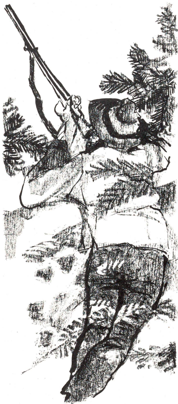
So erlegte ich ihn einst in der Morgendämmerung.

«Vermutlich wegen der schwachen Stunde, die jeden Menschen früher oder später einmal ereilt. Als ich plötzlich vor mir im Scheinwerferlicht zwei Männer mit schweren, in Tücher gehüllten Räfbürden erblickte, dachte ich automatisch: Oha – auf Plattenalp oben ist wieder ein Rind erfallen! – Dass man das Fleisch einer Not-schlachtung zur Nachtzeit nach der Passstrasse hinunter und dem Dörflein zu trug, war ja bei der auch im Nachsommer noch herrschenden Fliegenplage nicht weiter verwunderlich. Im Vorüberfahren stellte ich noch fest: Der Toni und der Hanspeter sind's wahrscheinlich gewesen... Im übrigen war ich rechtschaffen müde; ich hatte das ganze Reservat am Pass oben kreuz und quer abgeklopft, und weil mir seit Monaten nie mehr eine Spur von Wildfrevell zuhanden gekommen war, hegte ich an diesem Abend überhaupt keinen argwöhnischen Gedanken. Solche, die irgendwie den Zwölfender von Platten betrafen, jedenfalls schon gar nicht. Als ich ihn im