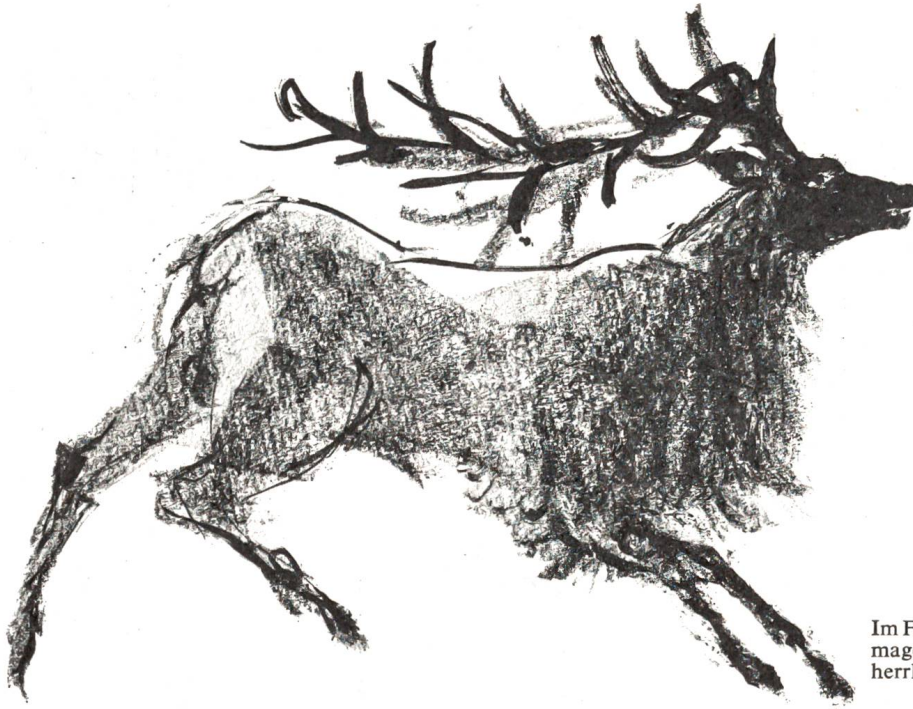
Im Frühsommer war er noch ziemlich mager. Aber bis im August wurde er herrlich feist.

Anderhalden langte seinen Tabaksbeutel hervor und stopfte von neuem. Wahrscheinlich liess sich die Beichte unter Dampf besser bewerkstelligen. Während des Anzündens sprach er in die Flamme: «Der Hirsch muss damals von weit ennet den Bergen zu uns herübergewechselt sein. Hier im Tal gab's meines Erinnerens nie welche...»