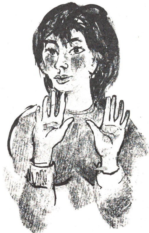
«Ich kann mich nicht fürs Leben einem Wilddieb anvertrauen!»

«Ja – und?» forschte Bergmann nach einigem Schweigen draufgängerisch. «Du hast jetzt immerhin die ganze Geschichte ordnungsgemäss gebeitet. Wenn du willst», er schmunzelte dabei schon wieder merklich, «zahlst du noch einen Beitrag in den Fond für Wildschadenvergütung. Und wenn wieder einmal ein Zehn- oder Zwölfender, vielleicht auch nur eine Kuh, aus dem Fänggital herüberwechseln sollte, bleibst du hübsch ruhig. Es gibt ja heutzutage nicht mehr so magere Winter.» Lachend klopfte er seine er-