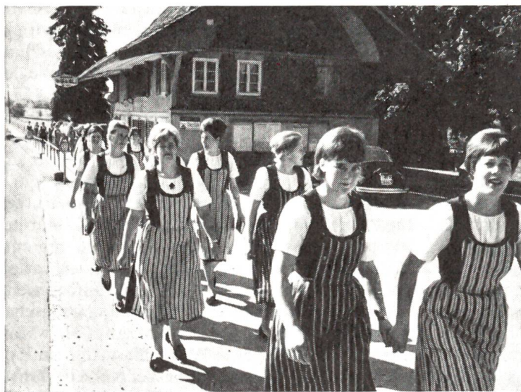
Schülerinnen der landwirtschaftlichen Schule Schwand bei Münsingen in ihrer Sonntagstracht auf dem Weg zum Gottesdienst

«Aber...» machte die Trine baff. «Das wird doch nicht sein...» Sie blickte die beiden Männer verständ-