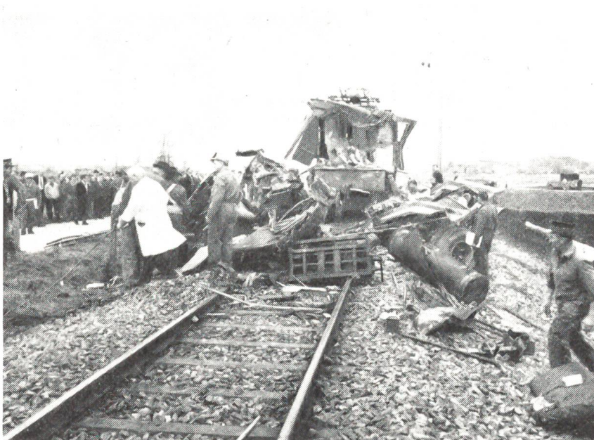
Ein Zusammenstoss auf dem Bahnübergang in Galmiz bei Murten zwischen dem Zug und einem Langholztransport forderte 5 Tote.

Glücklicherweise traf noch eine kinderreiche Familie zum Festessen ein – vielleicht begnügte sich ein kleines Kind mit einer einzigen Forelle. Man musste freilich mit einem kleinlichen Haus-