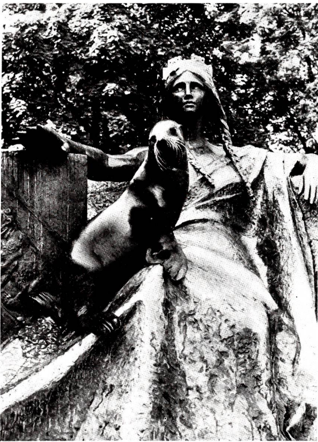
Mutter Helvetia ist nicht aus der Ruhe zu bringen. Selbst der Seelöwe des Zirkus Knie auf ihrem Schoss kann sie auf dem Weltpostdenkmal in Bern nicht erschüttern.

«In Herrn Professor Doktor Heini Hediger be- sitzt der Zürcher Zoo einen Leiter mit grossem Fachwissen und Idealismus. Dass er in seiner Persönlichkeit einen eigenen Zuschnitt zeigt, das lässt die Schöpfung zu...»