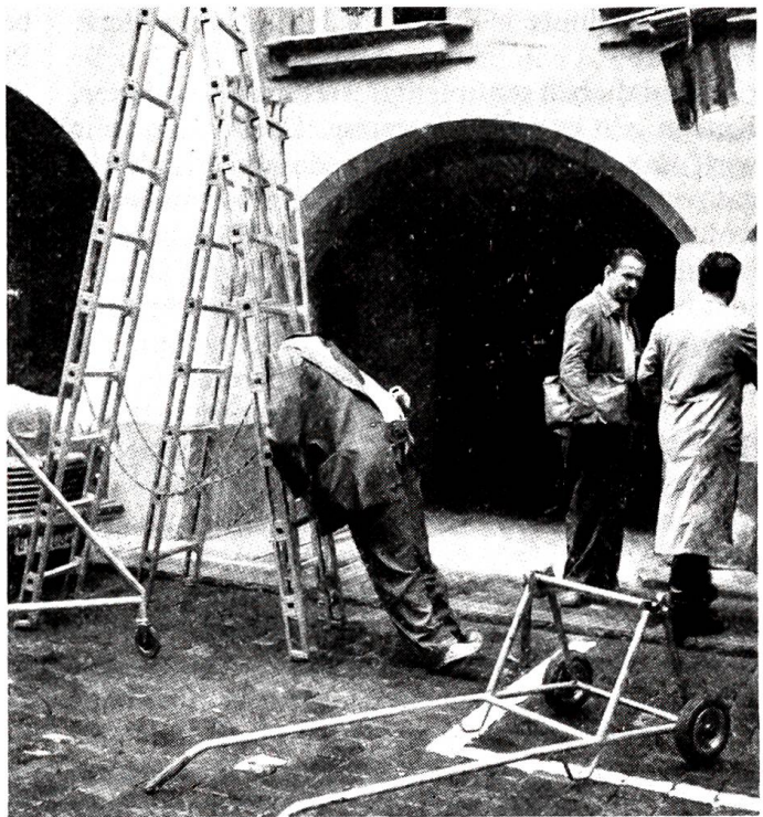
Eine kopflose Geschichte

Bis zum Fluss hatten wir eine schwache halbe Stunde zu marschieren. Mit jedem Schritt wuchs mein Unbehagen. Was, zum Kuckuck, hatte uns der unglückliche Kater, dieser verspielte und lustige Mohr, angetan? Sie musste ihn verkehrt behandelt haben; fast immer liegt es ja an uns Menschen, nicht an den Tieren. Wie oft hatte er sich abends in mein Zimmer geschlichen, mich zärtlich schnurrend umschmeichelt, sich endlich mit unnachahmlicher Grazie hingelegt und mich unablässig mit seinen rätselhaften bernsteingelben Augen betrachtet. Und jetzt begleitete ich ihn auf seinem letzten Gang. Ich war es sogar, der seinen Henker bestimmt hatte. Bloss um der staublappenhörigen Frau Perrig gefällig zu sein. Im Lenz seines Lebens sollte er elendiglich er-