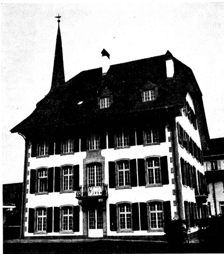
Schloss Riggisberg nach Abschluss der Renovationsarbeiten 1970