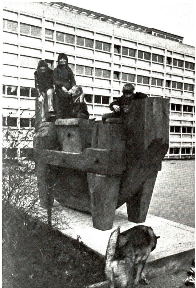
Der hölzerne Dackel

«Die Steuerkommissäre werden ja bekanntlich in keinem unserer zahlreichen Kantone besonders geliebt – nicht einmal von ihren eigenen Frauen, soweit sie natürlich verheiratet sind – und das aus dem ganz einfachen Grunde, weil sie es nun einmal nicht immer verstehen, ihre Herz- und Lieblosigkeit zusammen mit Hut und Mantel an den Nagel zu hängen...»