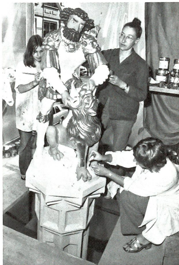
Simson-Brunnen neu bemalt