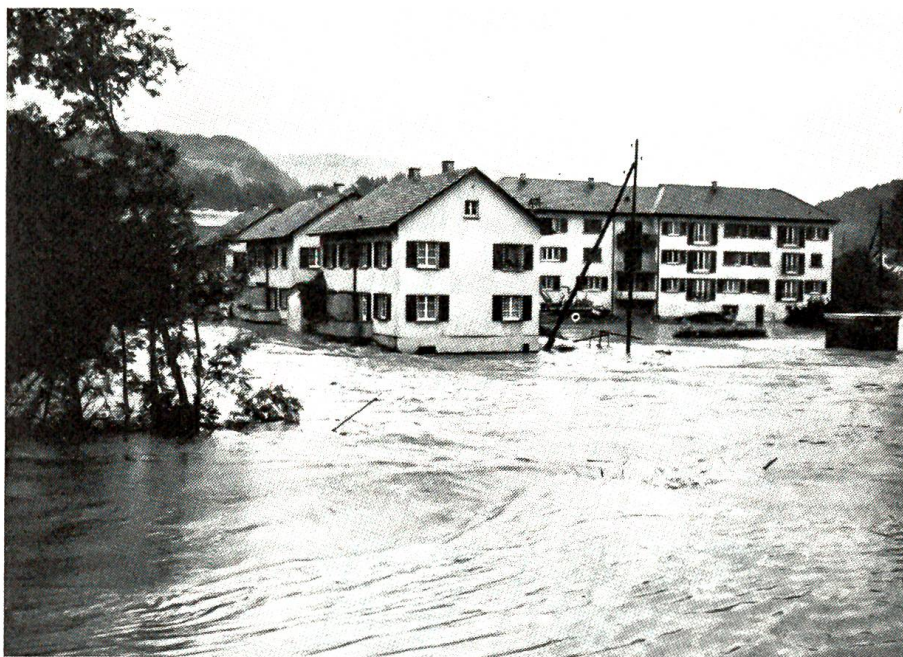
Schwere Überschwemmungen im Birstal

Ein unbändiger Trotz überkam ihn. Hätten die beiden das Geldstück nicht auch behalten können wie er, statt es ihm wieder aufzudrängen? Musste er fast einen Franken bezahlen, bloss weil die beiden eine so fanatische Ehrlichkeit entwickelten? Wo stand er jetzt? Das Fünffrankenstück musste er los sein, er ertrug die Spannung nicht mehr. Aber wo bot sich eine