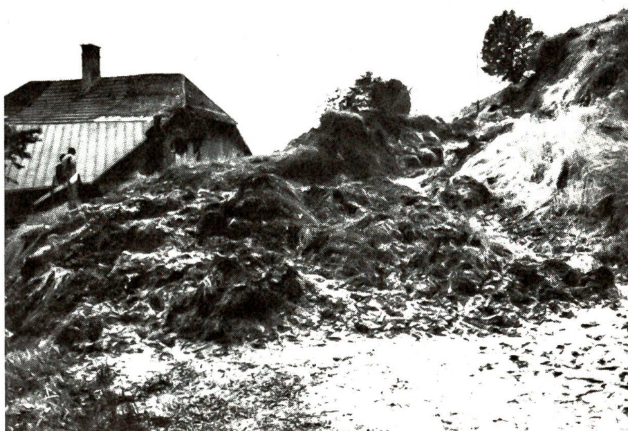
Erdrutsche schliessen Eriz von der Umwelt ab

Einige Schritte nur. Dann hörte er eine rufende Stimme hinter sich: «Sie, Herr!» – Ein junger Mann kam eilig auf ihn zugeschritten: «Sie haben soeben das da verloren. Ich sah, wie