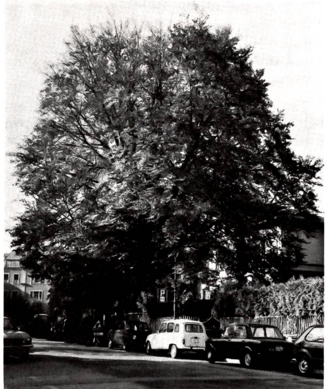
Musste das sein?