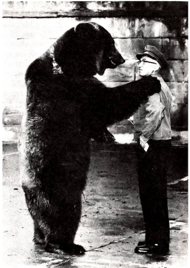
Abschied vom alten Bärenwärter

«Bevor ich jedoch die Summe anweisen lasse, sind noch ein paar Formalitäten zu erledigen.