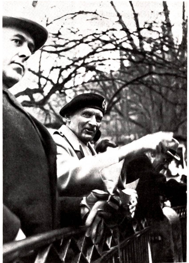
Feldmarschall Montgomery gestorben

Sein Ziel war nicht mehr fern. Der Zwiebelturm tauchte über den Bäumen auf. Er schlenderte durch gepflegte Baumgärten, in denen der Segen des Herbstes üppig reifte. Fruchtbare Apfel- und Birnbäume belebten den Wiesenplan, ausserdem bemerkte er mit Wohlgefallen Zwetschgen- und Pflaumenbäume, die reich behangen waren, und besonders einer von den Pflaumenbäumen erregte Lindenmeyers Aufmerksamkeit, denn er war dermassen mit samtig-blauen und annähernd hühnereigrossen Früchten beladen, dass dem Laub nur noch dekorative Bedeutung zukam. Ob er wollte oder nicht, er