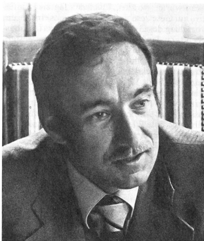
Der neue bernische Regierungsrat: Peter Schmid

Dank seiner bisherigen Tätigkeit als Zentralsekretär der Schweizerischen Volkspartei (SVP) bringt er viel Erfahrung in seine neue politische Tätigkeit mit.