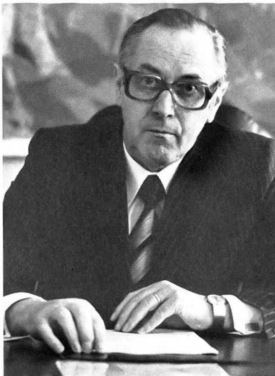
Hans Hürlimann Bundespräsident für das Jahr 1979

Ein drittes Thema von erstrangiger Bedeutung stellt die in der Berichtsperiode eingeleitete wirtschaftliche Öffnung der Volksrepublik China gegenüber der Aussenwelt dar. Die von den Nachfolgern Maos eingenommene Haltung soll schliesslich zu einer Einfügung Chinas in die