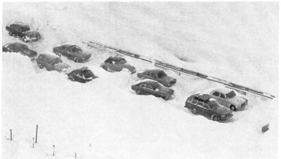
Schwere Schneestürme in Norddeutschland

In Europa haben im vergangenen Jahr eine Anzahl von Wahlen und Abstimmungen stattgefunden, die aber – mit wenigen Ausnahmen – im grossen ganzen die politischen Kräfteverhältnisse bestätigt haben. Es ist in vielen Staaten Europas ein Abflauen der Tendenz nach links festzustellen; dies sogar in Finnland , das sich im direkten Einflussbereich der Sowjetunion befindet und sich deshalb auch in innenpolitischen Manifestationen grosser Zurückhaltung zu befehligen hat. In Spanien ist die Rückkehr zu einem demokratischen Rechtsstaat nach dem Fahrplan der Regierung Suarez vorangeschritten. Am 6. Dezember haben sich die Stimmbürger Spa-