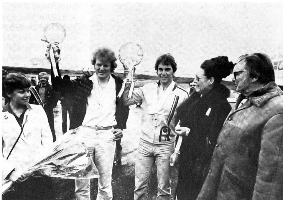
Erfolgreiche Schweizer im alpinen Skisport