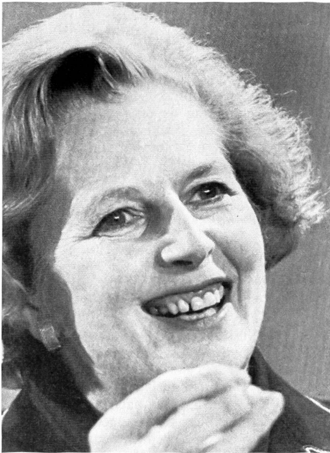
Premierministerin Margaret Thatcher

Seit anfangs Mai 1979 hat England als erster westeuropäischer Staat eine Regierungschefin.