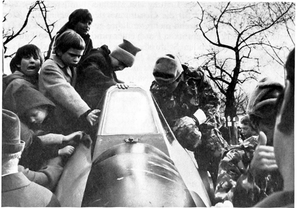
Grosse Wehrschau in der Stadt Zürich

Im November wurde im Kanton Jura das kantonale Parlament gewählt, wobei sich eine Sitzverteilung wie folgt ergab: CVP 21 Sitze, FDP 14, SP 11, CSP 8, Reformfreisinnige 3, PdA 2, SVP 1. Nicht dieser Sitzverteilung entsprechend ist die Bestellung der ersten Regierung des Kantons Jura ausgefallen: Das Rassemblement jurassien (RJ) machte seinen politischen Einfluss dahingehend geltend, dass die Freisinnigen für ihre (anfänglich) antiseparatistische Haltung durch Ausschluss aus der Regierung «bestraft» werden sollten. Das Regierungskollegium ist