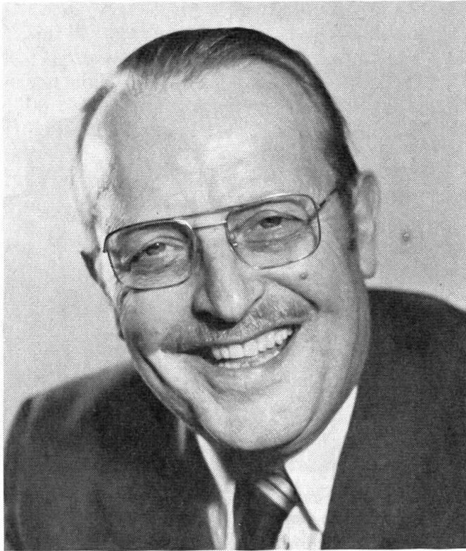
Regierungsrat Dr. Ernst Jaberg zurückgetreten

Seit 1966 leitete er die kantonale Justizdirektion; auch als Präsident der Juradelegation der Berner Regierung ist er besonders hervorgetreten.