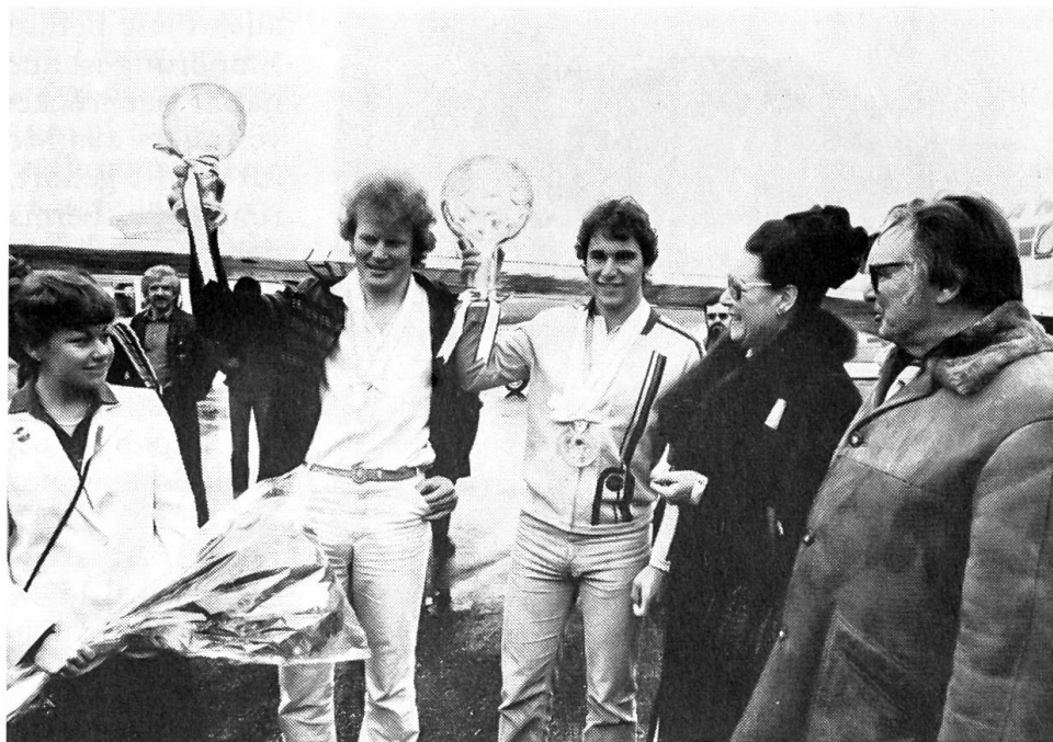
Erfolgreiche Schweizer im alpinen Skisport