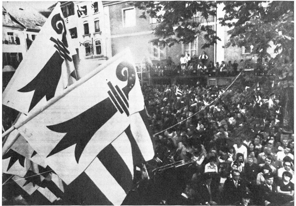
Am 24. September 1978 stimmte das Schweizervolk mit überwältigendem Mehr der Gründung des Kantons Jura zu.

Nicht-Amerikaner ersetzt. Die Beziehungen zu Japan haben im vergangenen Jahr, vor allem wegen handelspolitischer Meinungsverschiedenheiten, eine Krise durchgemacht. Hingegen verbesserten sich die Beziehungen zu China laufend. Vor Weihnachten sind überraschend die diplomatischen Beziehungen mit Peking wieder aufgenommen worden, wobei allerdings die USA de jure von Taiwan abrücken mussten. Teng Hsiao-ping hat die USA besucht. Die USA liessen sich aber von dessen Polemik gegen die UdSSR nicht beirren und hielten die Kontakte zu Moskau aufrecht. Obschon diese merklich kühler geworden sind, befehligen sich beide Supermächte fortwährend eines bemerkenswerten internationalen «Krisenmanagements» in gegenseitiger Abstimmung. Die Einigung über eine Beschränkung strategischer Waffen (SALT II) ist nun wider Erwarten zustande gekommen. Am Ende der Berichtsperiode steht man vor der Möglichkeit eines Zusammentreffens zwischen