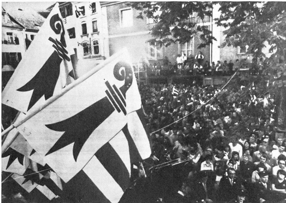
Am 24. September 1978 stimmte das Schweizervolk mit überwältigendem Mehr der Gründung des Kantons Jura zu.

Auf dem Gebiet der Aussenpolitik hat Carter den Zusammenhalt der USA mit den Verbündeten über den Atlantik hinweg durch persönliche Kontakte und ein Gipfeltreffen in der Karibik gestärkt. Die Nato, nachdem sie nun 30 Jahre alt geworden ist, soll konsolidiert und militärisch schlagkräftiger gemacht werden. Der Oberkommandierende der Nato, der amerikanische General Haig, hat demissioniert und wird durch einen Nicht-Amerikaner ersetzt. Die Beziehungen zu Japan haben im vergangenen Jahr, vor allem wegen handelspolitischer Meinungsverschiedenheiten, eine Krise durchgemacht. Hingegen verbesserten sich die Beziehungen zu China laufend. Vor Weihnachten sind überraschend die diplomatischen Beziehungen mit Peking wieder aufgenommen worden, wobei allerdings die USA de jure von Taiwan abrücken mussten. Teng Hsiao-ping hat die USA besucht. Die USA liessen sich aber von dessen Polemik gegen die UdSSR nicht beirren und hielten die Kontakte zu Moskau aufrecht. Obschon diese merklich kühler geworden sind, befehligen sich beide Supermächte fortwährend eines bemerkenswerten internationalen «Krisenmanagements» in gegenseitiger Abstimmung. Die Einigung über eine Beschränkung strategischer Waffen (SALT II) ist nun wider Erwarten zustande gekommen. Am Ende der Berichtsperiode steht man vor der Möglichkeit eines Zusammentreffens zwischen