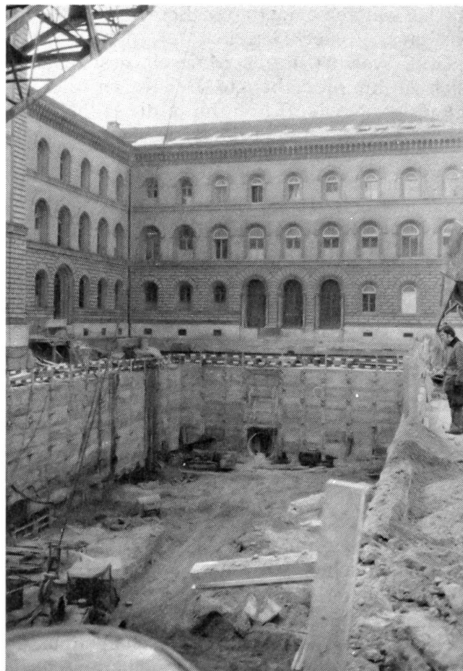
Personenschutzräume für das Bundespersonal Im Hofe des Bundeshauses-West dient diese mächtige Baugrube der Erstellung von vorgeschriebenen Schutzräumen.

Madeleine de Langard nickte: «Liebe lässt immer Wunder geschehen.» Dann ging sie hinaus, um das grüne Seidenkleid auszuziehen.