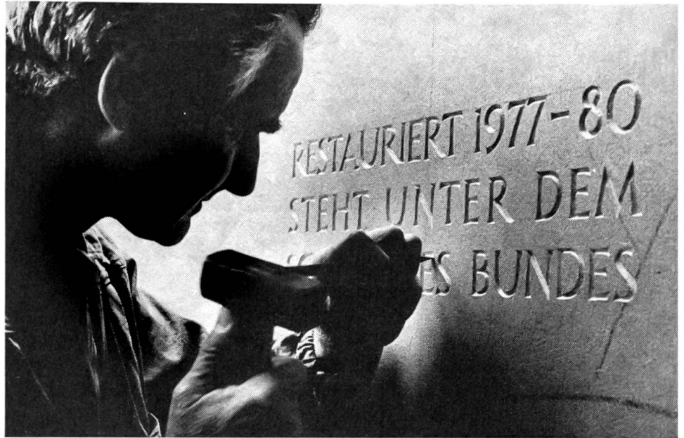
Der letzte Akt am renovierten Käfigturm in Bern

Wir hatten uns in Gedanken immer einen flachen, sonnenüberstrahlten Gebirgssee vorgestellt, aber der See, in dem das Kreuz liegen sollte, war nur eine schmale Schlucht, eigentlich nur eine Felsspalte, am Rand einer fast senkrechten Steilwand, deren oberer Teil aus losem Geröll zu bestehen schien. Wie tief das