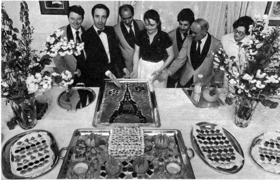
Der «Quatorze Juillet» wird auch in Bern gefeiert Die Küchenbrigade der französischen Botschaft in Bern ist auf die Gäste vorbereitet...

dann eine Weile gar nichts. Die zwei Indios pumpen mit ausdruckslosen Gesichtern.