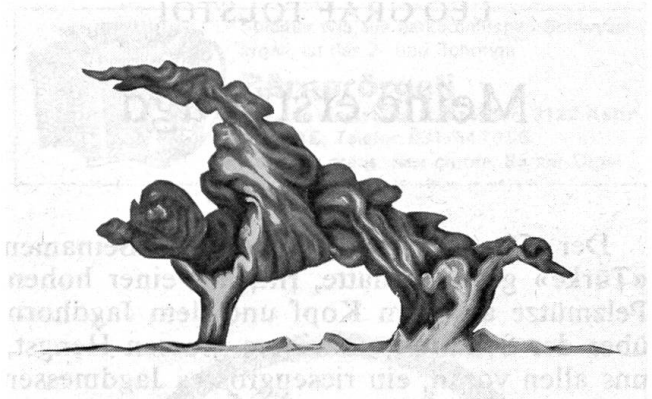
Eine Fackel rotglühender Gase (Protuberanze) erhebt sich mit einer Ausdehnung von mehr als 100 000 km über die Sonnenoberfläche (Beobachtung von Trouvelot).

Wie wird nun das Schicksal der Sonne sein, wenn ihr in ein paar Milliarden Jahre der Brennstoff ausgeht? Wird ihre Strahlkraft einfach langsam abnehmen? Man nimmt das Gegenteil an. Wenn nämlich ihr Wasserstoffgehalt in Helium umgesetzt sein wird, nimmt das