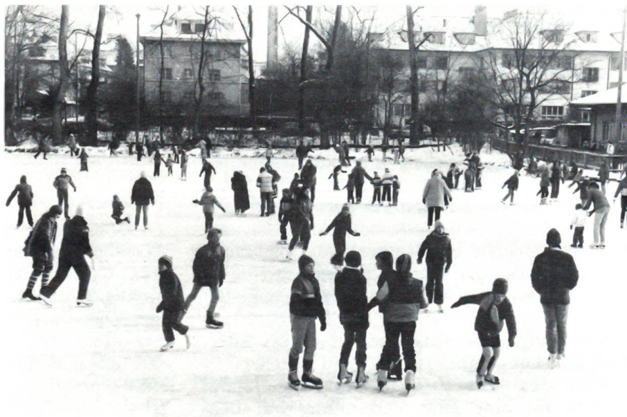
Die Kälte im Januar 1985

Jene Fremdenführer, die ihre Gefolgschaft mit der finsternen Entschlossenheit durch die Gemächer führen wie Hannibal seine Elefanten über die Alpen, haben auch keinen Sinn dafür, dass man durch ihre Sehenswürdigkeiten in heitere Stimmung versetzt wird. Das Tintenfass, mit dem Samuel der Sanfte seinen Bruder Simon meuchlings zu erschlagen geruhte, der Radiergummi, mit dem Kuno der Keusche die Muttermale auf dem Rücken seiner Geliebten zu entfernen pflegte, und der