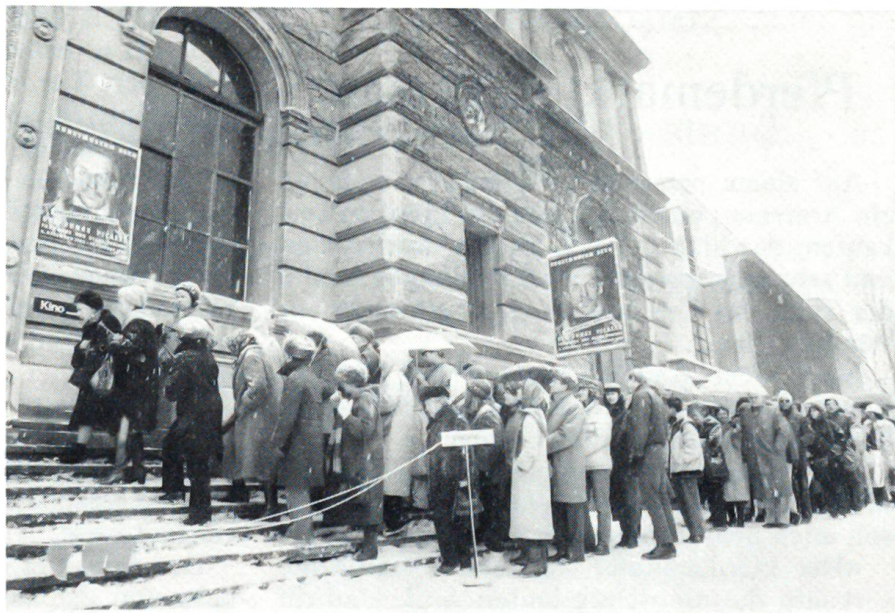
Grosser Erfolg der Picasso-Ausstellung im Berner Kunstmuseum Selbst Kälte und Schneetreiben konnten den Grossandrang der Besucher im Frühjahr 1985 nicht vermindern.

Ich denke gern an sie. Wenn die Dämmerstunden kommen, wünsche ich mir wohl auch