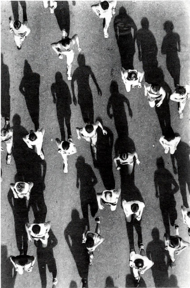
Schattenspiel am Grand Prix von Bern

viele Besucher, Feriengäste und Reisende an, dass die Einnahmen bei sparsamstem Einsatz und viel aus Freude geleisteter Arbeit die Aufwendungen einerseits für den Betrieb, andererseits aber auch für eine stete weitere Entwicklung der Sammlung decken. Damit ist auch gesagt, dass neue Museumsstücke vorwiegend durch Ankauf aus dem Handel und nur selten durch Schenkung eingebracht werden. Das hat übrigens den Vorteil, dass die Sammlung nun, wenn auch in bescheidenem Rahmen, zielbewusst erweitert werden kann.