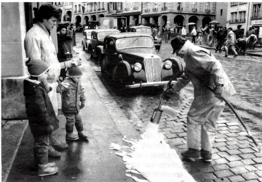
Künstlicher Schnee aus der Schaumkanone bei Filmaufnahmen in der Berner Altstadt Eine amerikanische Filmgesellschaft drehte Aussenaufnahmen in der Altstadt von Bern. Da das Drehbuch eine winterliche Stadt vorschrieb, musste der Schnee künstlich erzeugt werden.

Botanik: Die Pflanze wird den Lippenblütlern zugeteilt (Labiates). Sie ist ein 10–20 cm hoch wachsender Halbstrauch mit vierkantig behaarten Stengeln, die dünn, holzig und kurzstielig geartet sind. An den Stengeln wachsen gegenständig die 5–15 mm langen, linear-rundlichen Blätter, an denen die mit