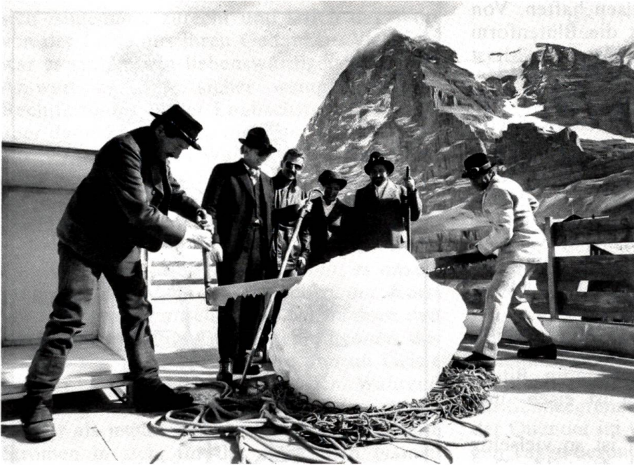
Werbeaktion für das Berner Oberland in Japan

Ein Eisblock vom Eigergletscher wird (unser Bild) von sechs Oberländer Kurdirektoren zersägt und dann in einem Kühlschranks nach Japan geflogen, um bei Fremdenverkehrswerbungen als Attraktion ausgestellt zu werden.