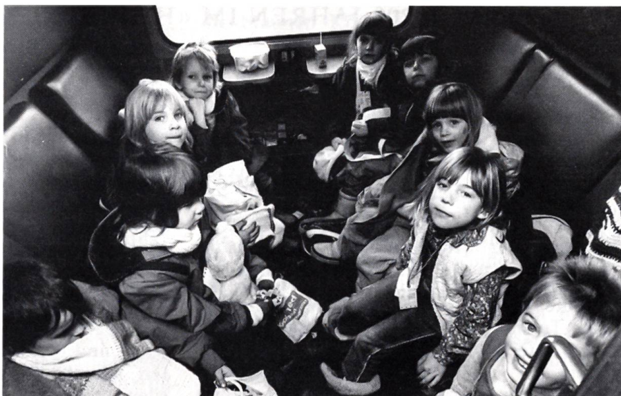
Ferien für Kinder aus Berlin

Am Abend in einem sehr teuren Restaurant – diese Einladung war der Lohn für meine ge-