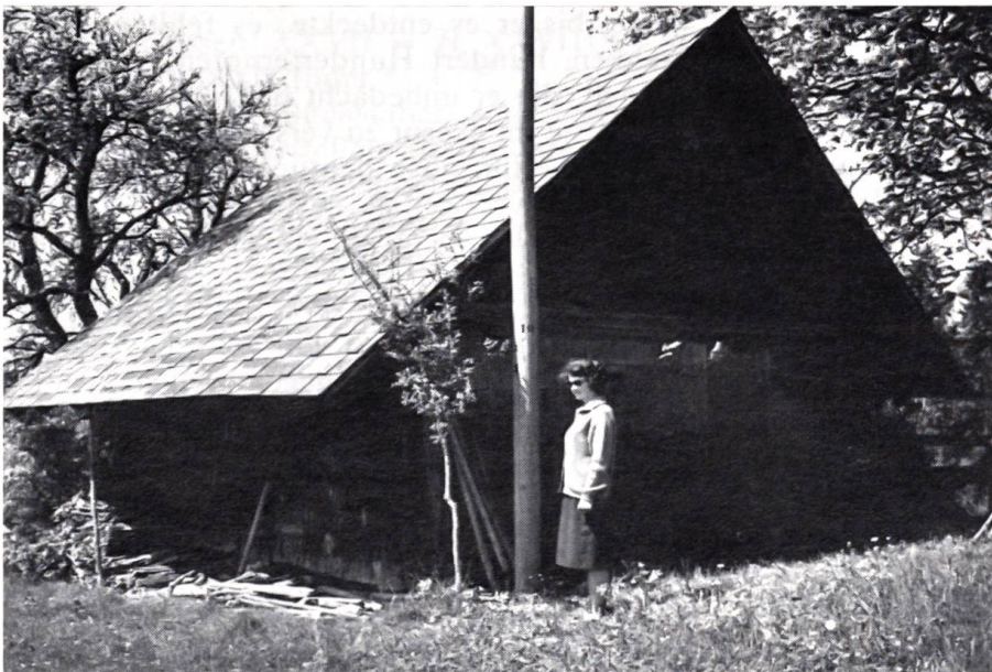
Kriegs-Alarm im alten Bern

brauchte, vor den Bauch gebunden, wo jeder, der wollte, mit der an einer Schnur baumelnden Kreide draufschieben konnte, für was er uns hielt. Damit trugen wir allerhand zur allgemeinen Erheiterung bei. Wir waren z. B. eine Zeitlang «Gürteltiere von innen». Das interessierte uns natürlich wenig. Wir waren ja auf der Suche nach Knüssli. Noch hatten wir ihn nicht geortet. Da aber bekam mein Freund Witterung. Sie führte uns an die Bar. Dort stand ein Fliegenpilz, nicht schlecht gemacht. Der Mann stak in einer grauen Kartonröhre, die oben mit einem weissbetupften roten Schirm abschloss.