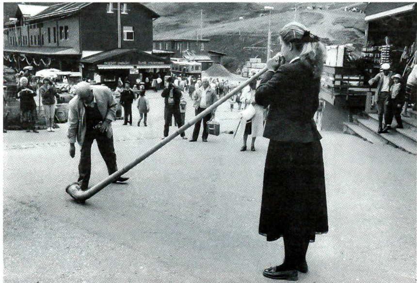
Gleichberechtigung beim Alphornblasen

Aus jener Epoche stammt das älteste noch erhaltene Fussballbild Englands, eine Schnitzerei am Chorgestühl der Kathedrale von Gloucester. Im folgenden Jahrhundert muss sich Fussball beinahe epidemisch ausgebreitet, die Leute von Arbeit und Waffenübungen abgehalten haben; denn unter Heinrich IV. wurden aus Anlass von Hochzeiten Geldstrafen gegen übermütige Fussballer, später bei Übertretung der Verbote sogar neben einer Busse