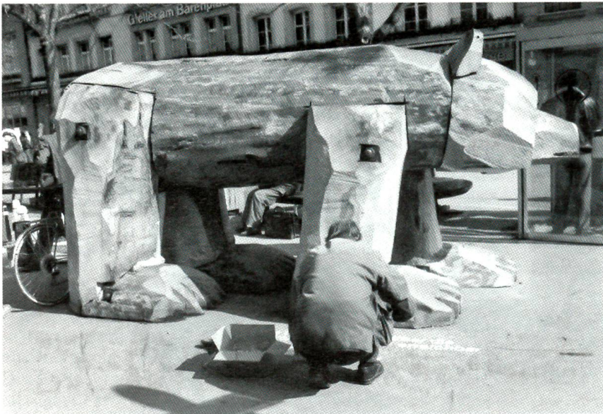
Eine Bären-Skulptur auf dem Bärenplatz

In den folgenden Jahrzehnten tauchen immer wieder Gerichtsurteile gegen Fussballer auf, die den Sonntag nicht geheiligt hatten; und als 1692/94 der Berner Beat Ludwig de Muralt seine Englandreise machte, fiel ihm auf, wie gross die Zahl der jungen Menschen war, die sich ein Vergnügen daraus machten, auf den Strassen Londons mit Fusstössen einen Ball