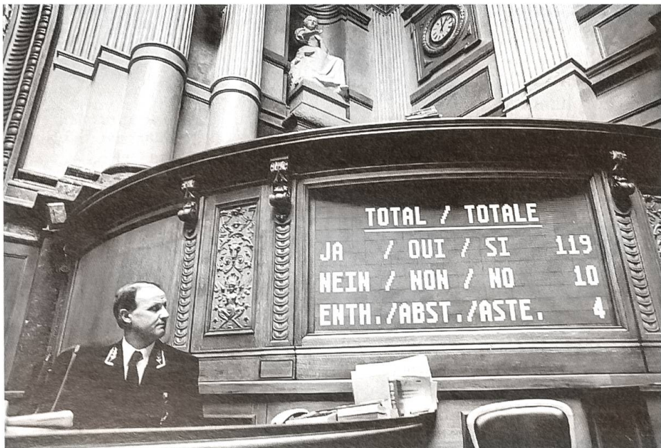
Elektronische Abstimmungsanlage im Nationalrat Neuerdings stimmen die Mitglieder des Nationalrates per Knopfdruck elektronisch ab.

Eine grössere Zahl von innenpolitischen Fragen, die nicht auf die lange Bank geschoben werden dürfen, ist pendent geblieben – so etwa die Ausgestaltung und Finanzierung der ungenügenden Arbeitslosenversicherung, die 10. AHV-Revision, die Regierungsreform, die Sanierung des tief in die roten Zahlen geratenen Bundeshaushalts, welcher 1993 ein Rekorddefizit von 7,8 Mrd. auswies und auch 1994 nichts Besseres verspricht. Die Diskussionen über die Bundesfinanzen drehen sich zentral um die Frage, wieviel und aus welchen allenfalls ergiebigen Einnahmequellen noch zusätzliche Gelder für die Bundeskasse beschafft und, auf der anderen Seite, um wieviel und wo Bundesausgaben gehörig zurückgestutzt werden können. Mehrere Sanierungspakete folgen sich auf dem Fuss; doch es sieht ganz so aus, als ob in der absehbaren Zeit ein recht hoher Defizitsockel übrigbleibe und sich der Bund somit noch mehr verschulden müsse, bevor allenfalls das Gleichgewicht in den Bundesfinanzen wieder hergestellt ist. Ein auch starker konjunktureller Wiederaufschwung würde nämlich keineswegs die Defizite von selber zum Ver-