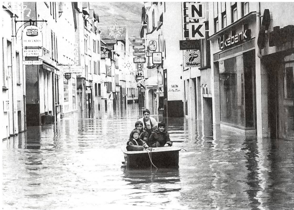
Schwere Überschwemmungen in Deutschland, Frankreich, Holland und Belgien Kurz vor Weihnachten 1993 führen diese Hochwasser zu Millionenschäden und zu zahlreichen Evakuierungen. Unser Bild zeigt eine überschwemmte Geschäftsstrasse in Köln.

Der östliche Teil von Europa, seit einigen Jahren glücklich dem sowjetischen Joch entronnen, laboriert nach wie vor an der umständelhafter äusserst schwierigen Normalisierung der