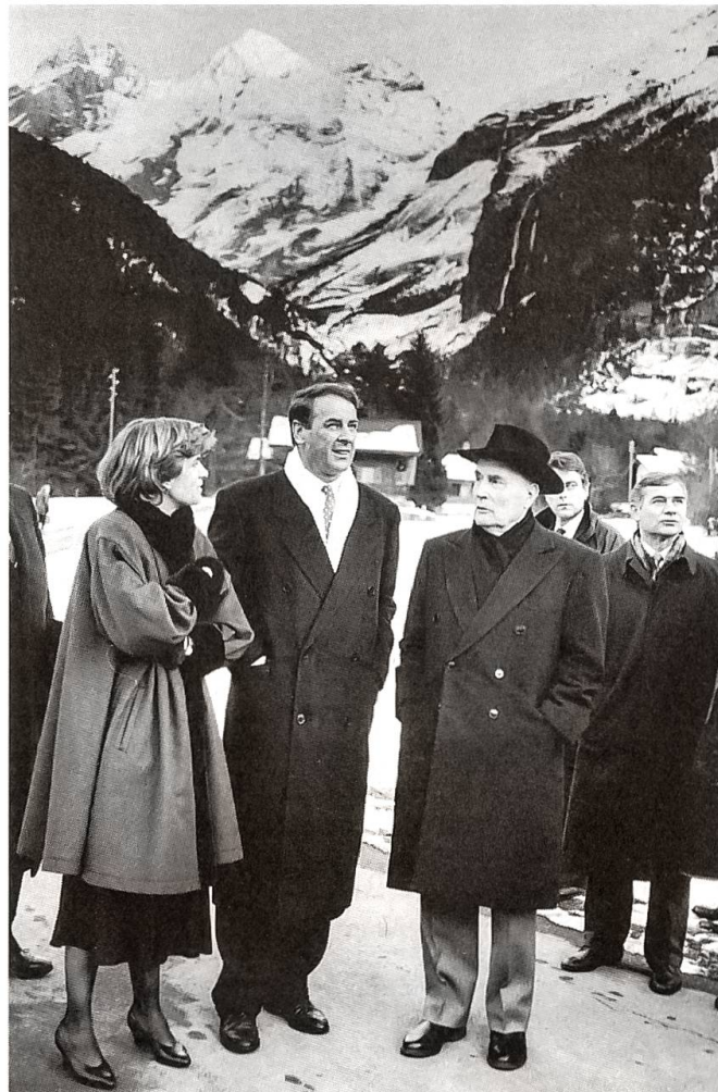
Ein Höhepunkt im Amtsjahr von Bundespräsident Ogi Der französische Staatspräsident Mitterrand (mit Hut) besucht Bundespräsident Ogi in dessen Heimatgemeinde Kandersteg.

Auch das Parlament hat sich reich befrachtete Traktandenlisten zugemutet. Wegen dringender