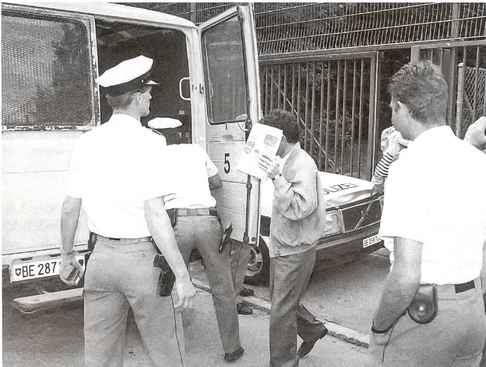
Schiesserei bei der türkischen Botschaft in Bern

Zur Chronik der Stadt Bern : Die seit Januar 1993 hier regierenden rot-grünen Mehrheiten in Gemeinderat (Exekutive) und Stadtrat (Legislative) betrieben eine provozierende Machtpolitik, wobei ein sonderbares Finanzgebaren auf Widerstand stösst. Bereits zweimal hat das Volk das Budget für 1994 abgelehnt, so dass diesbezüglich noch eine dritte Volksabstimmung