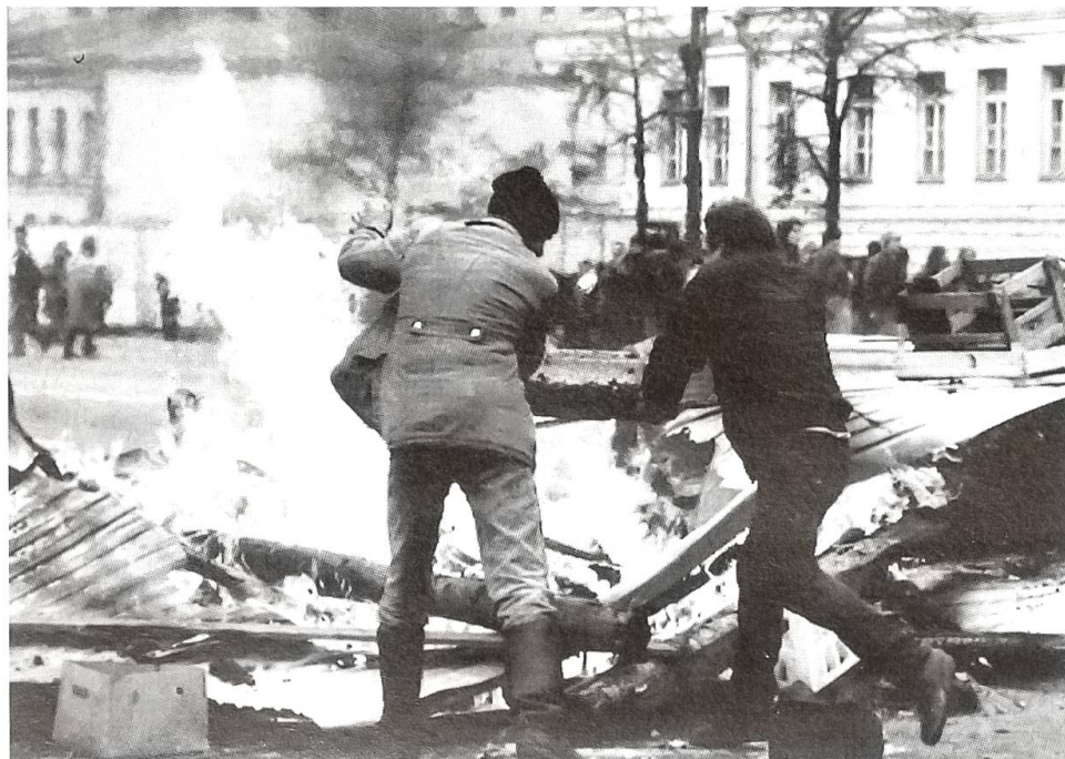
Machtkampf in Moskau

Nach der Auflösung des Parlamentes durch Präsident Jelzin am 21. September 1993 kommt es in der russischen Hauptstadt zu tumultuösen Auseinandersetzungen. Unser Bild zeigt Demonstranten beim Bau von Barrikaden in der Moskauer Innenstadt. Erst massiver Einsatz von Panzern bringt die Jelzin-Gegner zur Kapitulation.