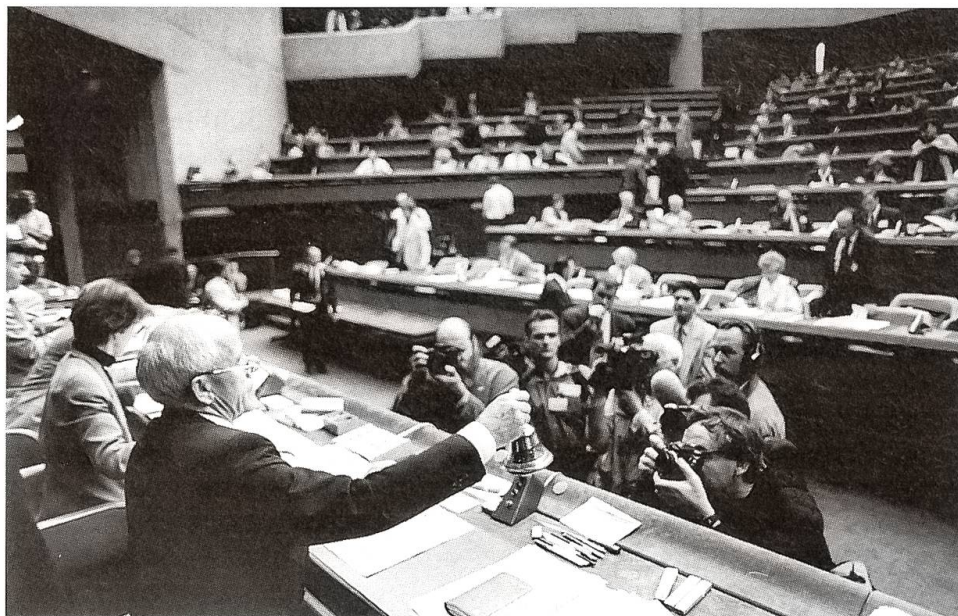
Herbstsession der Bundesversammlung in Genf Wegen Renovationsarbeiten im Nationalratssaal in Bern tagen die eidgenössischen Räte erstmals ausserhalb der Bundesstadt.

Die Schweiz leidet noch immer stark unter der Rezession. Insbesondere ist die grosse Zahl von Arbeitslosen zu einer schweren Bürde geworden. Immerhin sind neuerdings einige Lichtblicke sichtbar. Die Exporte entwickeln sich leidlich gut, und seit der zweiten Hälfte 1993 zieht auch die Nachfrage auf dem Binnenmarkt allmählich wieder an. Die Teuerungsrate ist mittlerweile auf unter 1% abgesunken, und das tiefere Zinsniveau brachte den Gläubigern Entlastung. Auch die Mieten sind im Begriff ermässigt zu werden. Andererseits machen sich aber jetzt bei manchen Unternehmen die bedrohlichen Spätfolgen der Rezession erst richtig bemerkbar: neben Redimensionierungen, Firmenaufkäufen, Unternehmenszusammenschlüssen und Geschäftsaufgaben ist 1993 die Zahl der Konkurse in der Schweiz mit über 10 000 neu eröffneten Verfahren und mit geschätzten Verlusten von 2,5 Mrd. rekordbrechend geworden. In einigen Fällen konnten spektakuläre Pleiten von grossen und traditionsreichen Firmen trotz enormer Substanzverluste gerade noch verhindert werden. Die Liste der Aktien, die keine Dividenden mehr abwerfen, ist nachgerade lang und deprimierend. Andere Börsenpapiere wiederum haben im Gegensatz dazu eine beispiellose Hausse erlebt. Am Finanzplatz bereitet eine neue Modeerscheinung zunehmend Missbehagen: die sog. derivativen Finanzinstrumente schiessen wie Pilze aus dem Boden, und deren