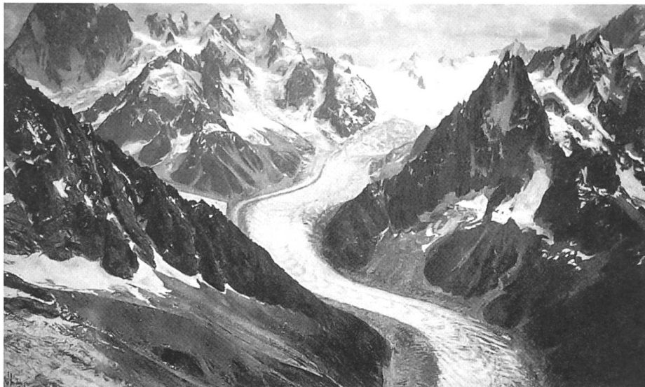
Montblanc-Gruppe aus ca. 3200 Meter über dem Chamonixtal Aufnahme aus dem Ballonkorb von Eduard Spelterini am 8. August 1909

unter. Zu ihrer grossen Überraschung fanden sie an der Pierre-Pointue ein ausgiebiges Frühstück vor, das ihnen Freunde entgegengetragen hatten. Sie hatten auch ein Maultier mitgebracht, das Mademoiselle hätte zu Tale tragen sollen. Aber sie weigerte sich, es zu besteigen. Sie wollte nicht den Eindruck erwecken, erschöpft zu sein.