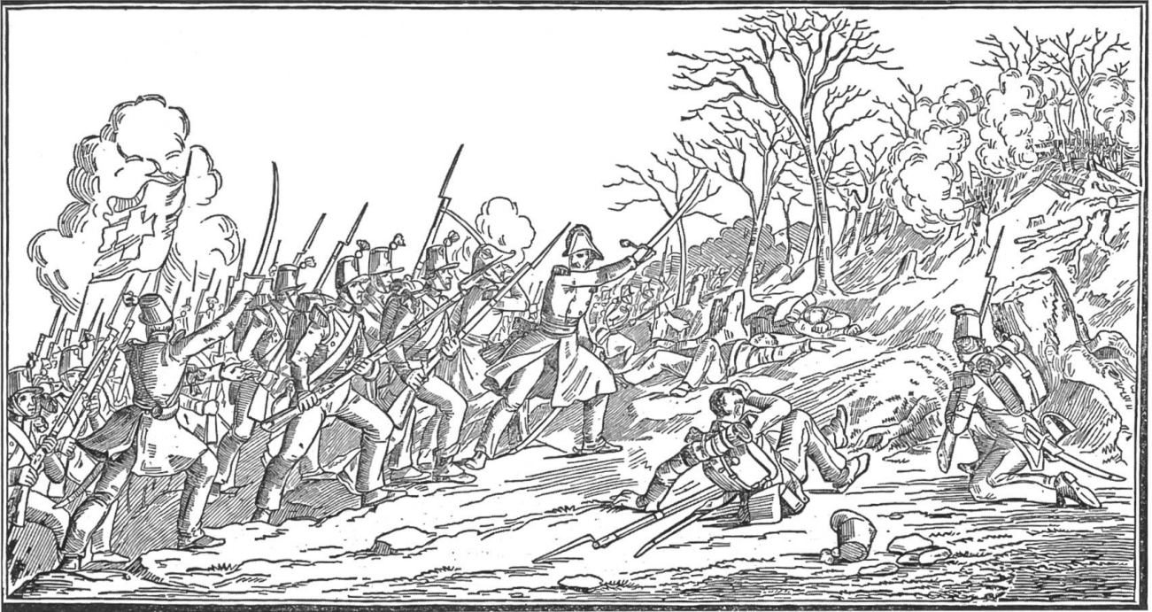
Sonderbundskrieg: Schlacht bei Gisikon im luzernischen Reusstal

in der Nacht vom 23. Wintermonat die Übergabe der Stadt Luzern. Anschliessend an die Besetzung der schwyzerischen March in den folgenden Tagen kapitulierten auch Schwyz, Unterwalden, Uri und Wallis. Den Schluss des Berichts bildete folgender Satz: «Hoffen wir, und tragen wir alle das unsrige nach Kräften dazu bei, dass fortan nie mehr im Vaterlande Bruderblut vergossen werden müsse.»