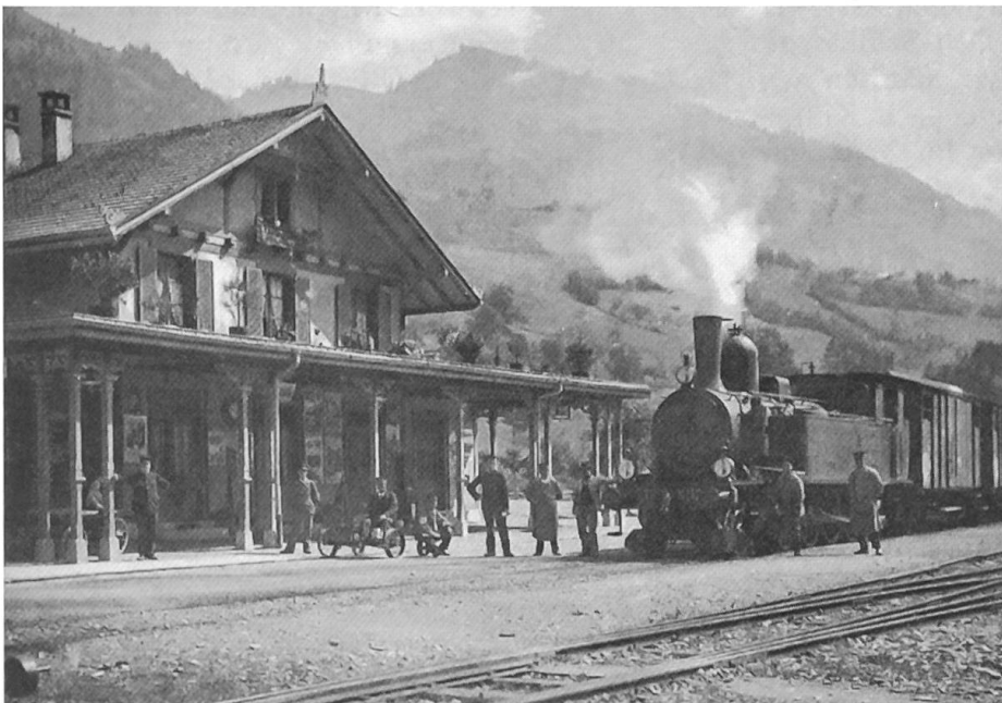
Bahnhof Erlenbach in den Anfängen der Spiez–Erlenbach-Bahn

Zum Rechtsanwalt kam ein Zigeuner und bat um Rechtsbeistand. Er war des Diebstahls angeklagt.