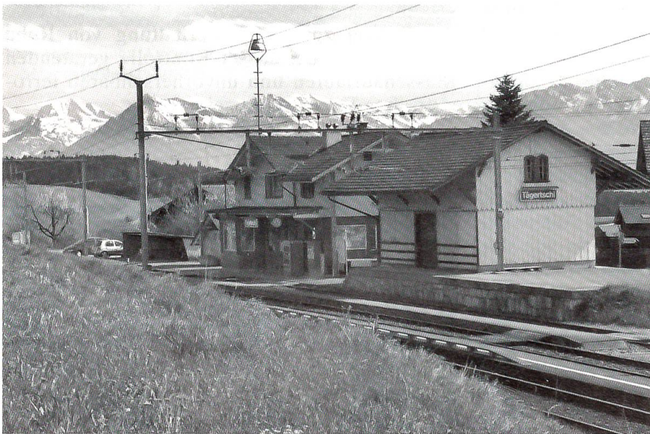
Station Tägertschi, alias Hëutlige, mit grandioser Aussicht

Gesellschaften, die sich bemühten, die Erlaubnis zur Errichtung möglichst rentabler Linienführungen zu erhalten. So baute 1854–1859 die «Schweizerische Centralbahn» mit Basel als Kopfpunkt ihres Netzes und mit Anschluss an die Eisenbahn aus dem Elsass die Linie Basel–Olten samt den Abzweigungen nach Aarau, Luzern, Burgdorf–Bern, Thun und Herzogenbuchsee–Solothurn. Zu ihr trat die «Ostwestbahn» in