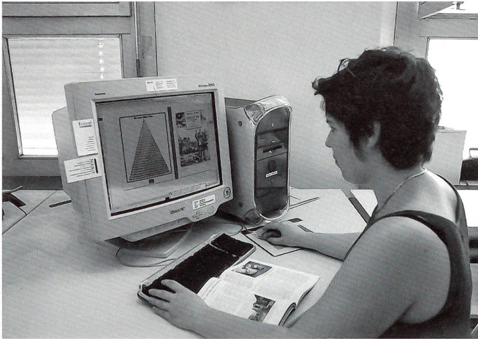
In diesem Raum an der Hallerstrasse wurde der 277. Jahrgang des Kalenders umbrochen ...

kende Bot» nichts von den speziellen Arbeitsumständen zu spüren bekamen. Wie viele Jahrgänge des «Hinkende Bot» am neuen Standort entstehen werden, lässt sich in unserer schnelllebigen Zeit nicht voraussagen.