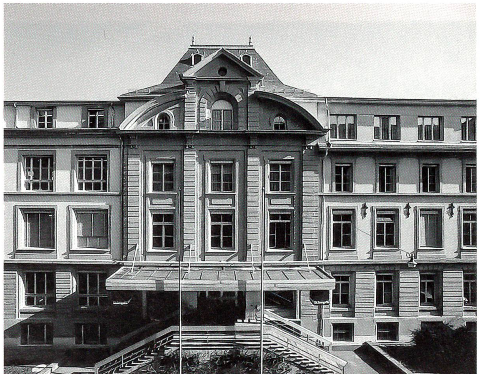
Das Sandsteingebäude an der Hallerstrasse im Länggassquartier, Sitz der Firma Stämpfli während 126 Jahren

In den letzten Jahren zeigte sich immer deutlicher, dass der Platz auch an der Hallerstrasse eng wurde und dass das alte Sandsteingebäude den Anforderungen an einen modernen Produktionsbetrieb nicht mehr zu genügen vermochte. Die Stämpfli AG hatte die Zeichen der