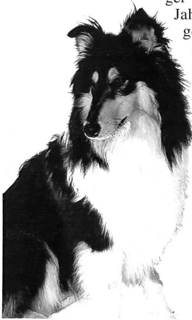
Puscha, die Colliehündin

Senta war ein Leben von zwölf Jahren gegönnt. Ein glückliches Leben in der grossen Lehrersfamilie mit dem Geschenk ausgiebiger Ferien zu allen Jahreszeiten, Ausflügen und Wanderungen aller Art.