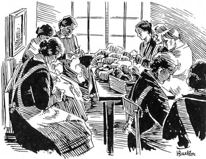
Berühmt geworden sind die vielen Karten und Plakate, die Hans Beutler während des Krieges für die Schweizer Nationalspende und die Soldatenweihnacht geschaffen hat. (Zeichnung: Hans Beutler)

engagierter Hilfe wurden diese mit selbst verdienten Batzen Jugendlicher finanziert.