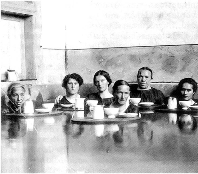
In der Frauenabteilung des Leuker Spitalbads um 1910. Im Armenbad hatten nur Kranke Zutritt, die ein «Armutzeugnis» vorweisen konnten

den medizinischen Neuerungen in den Hochburgen des Kurtourismus. Deshalb holten sie Hilfe bei Pfarrherren, Viehärzten, Hebammen und Kräuterfrauen – oder auch bei Scharlatanen.