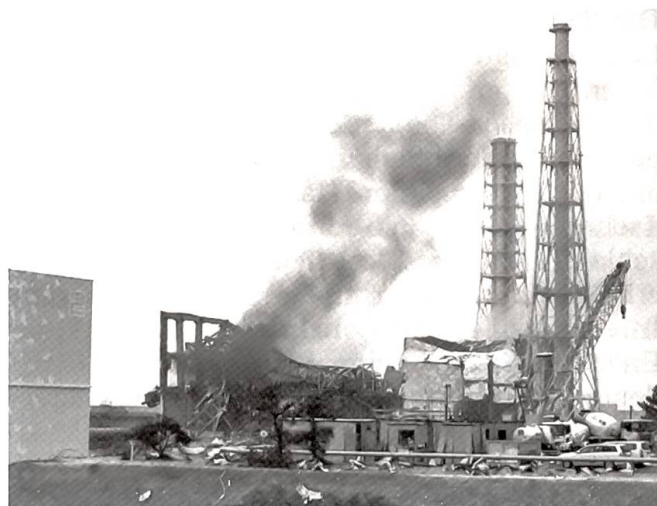
Das beschädigte Kernkraftwerk Fukushima

In der nordöstlichen Provinz Queensland von Australien fiel im Dezember ausserordentlich viel Regen. Hier machte sich die meteorologische Erscheinung «La Niña» stark bemerkbar. Dieses Wetterphänomen brachte der Westküste von Südamerika extrem trockenes Wetter und im Gegenzug erhielt die Westküste