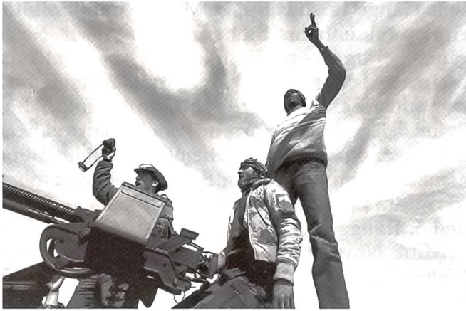
Bürgerkrieg in Libyen

Muammar al-Gaddafi. Nach dem 15. Februar gingen die libyschen Sicherheits- und Streitkräfte mit Schusswaffen gegen die Demonstranten der Opposition vor. Daraus entwickelte sich ein Bürgerkrieg mit vielen Toten. Die militärische Auseinandersetzung und der politische Konflikt spalteten die Führung des Landes. Teile des diplomatischen Korps und der Streitkräfte wechselten zur Opposition. Der Osten des Landes wird seitdem von ihnen beherrscht. Muammar al-Gaddafi und seine Gefolgsleute kontrollieren überwiegend die Städte des Westens und des Südens inklusive der Hauptstadt Tripolis. Die westliche Hafenstadt Misrata wird heftig umkämpft. Die Vereinten Nationen beschlossen in einer Resolution, dass militärische Massnahmen zum Schutz der zivilen Bevölkerung ergriffen werden können. Frankreich und Grossbritannien lösten bald Luftangriffe aus. Nach anfänglichem Zögern wegen Kompetenzfragen erfolgten die Luftangriffe unter NATO-Kommando.