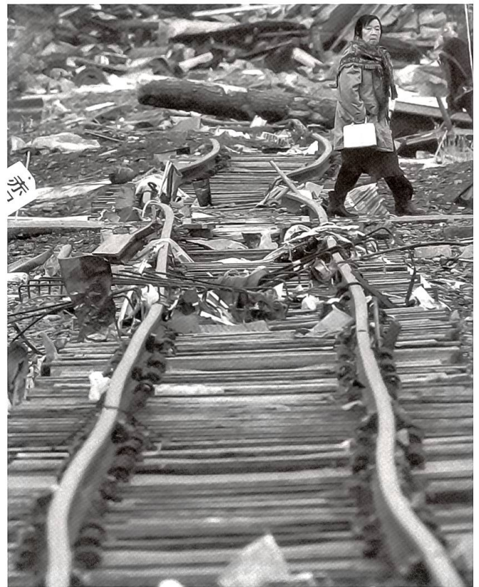
Enorme Schäden nach dem Erdbeben und dem Tsunami im Nordosten Japans

Am 11. März um 14.46 Uhr Ortszeit ereignete sich in der Nähe der Nordostküste von Japan, der Tohoku-Region, ein gewaltiges Erdbeben. Das Land wurde damit gleich mit drei