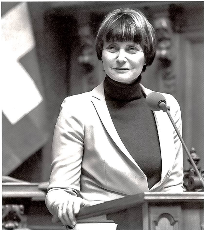
Micheline Calmy-Rey, Bundespräsidentin für das Jahr 2011

Im Berichtsjahr gab es ausserordentlich viele Ereignisse von grosser Bedeutung. Zwei dieser Vorkommnisse stachen besonders heraus. Sie sind von einer Tragweite, dass sie unsere Welt in vielen Belangen verändern werden.