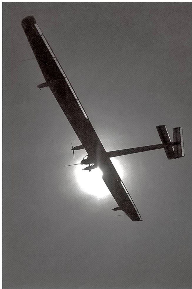
Solarflugzeug HB-SIA von Bertrand Piccard

Wegen eines Triebwerkbrands muss ein Superjumbo vom Typ A380 der australischen Fluggesellschaft Qantas in Singapur notlan-