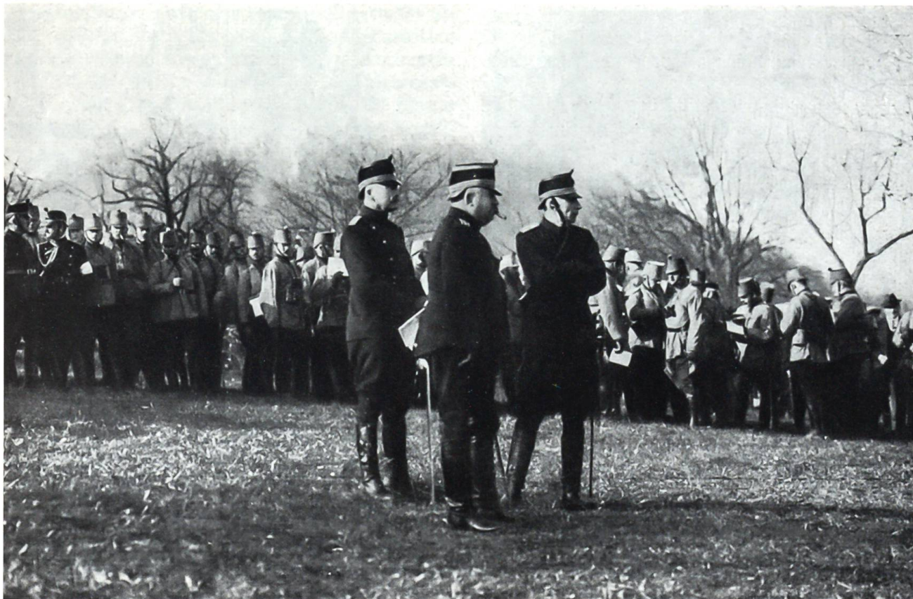
Die Schweizer Armeespitze im Ersten Weltkrieg: General Wille, flankiert von Generalstabschef von Sprecher (r.) und Generaladjutant Brügger