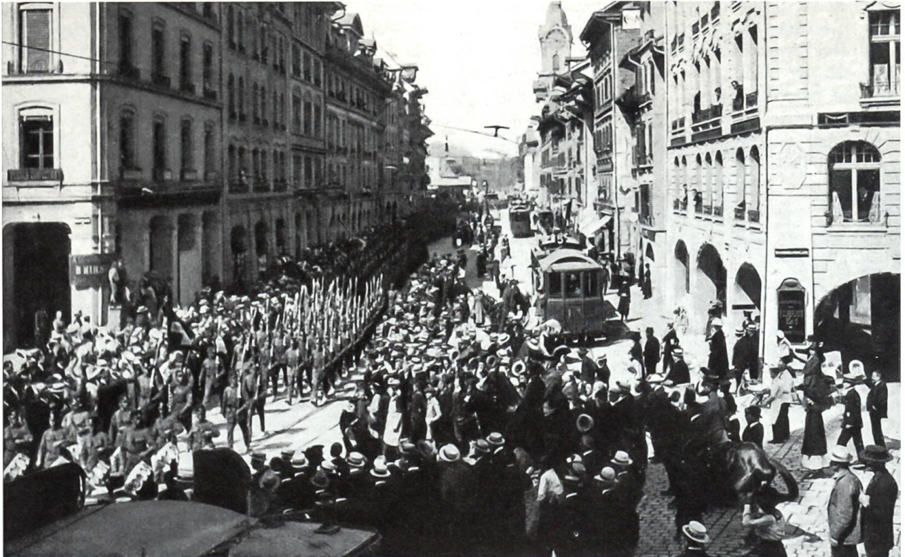
Truppendéfilée in Bern

steller Carl Spitteler am 14. Dezember 1914 in Zürich bei der Neuen Helvetischen Gesellschaft hielt. Deutlich hielt er fest: Jenseits der Grenze wohnen Nachbarn, diesseits der Grenze aber Brüder. Das ist ein gewaltiger Unterschied. Und: Freundschaft mit Nachbarn ist gut in Friedenszeiten, aber jeder kriegführenden Macht ist zu misstrauen. Sind wir als Demokraten nicht eher Geistesverwandte der französischen Republik als der deutschen Monarchie? Und: Die Feinde des deutschen Reichs sind nicht unsere Feinde. Angesichts des Trauerspiels ist für uns einzig ergriffenes, demütiges, ernstes Schweigen das richtige Verhalten. Die Rede wurde weitherum zur Kenntnis genommen. Spitteler aber wurde von da an in Deutschland für immer zur Unperson, während man ihn früher hoch gelobt hatte.