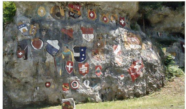
Chessiloch bei Grellingen BL: Wehrmänner gestalteten im Ersten Weltkrieg diesen Wappenfelsen.

Wie bei Kriegsgefahr vorgesehen, hatte die Bundesversammlung einen