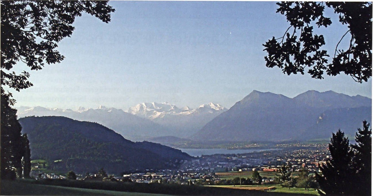
Vom Hartlisberg hat man eine imposante Rundschau auf Alpen und Voralpen und das im Vordergrund liegende Steffisburg.