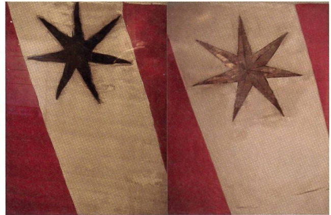
Altes Banner von Thun; linke Seite: schwarzer Wappenstern bis 1476, rechte Seite: goldener Wappenstern nach der Murten-Schlacht 1476, als Auszeichnung für das Banner Thun, dessen Mannschaft aus je einem Drittel Thurnern, Steffisburgern, Sigriswilern bestand.

Vom Landgerichtsort wurden die Verurteilten zur Richtstatt auf der Anhöhe oberhalb des Glockenthals, die heute noch Galgenhubel (Galgenrain) genannt wird, abgeführt. Das alte Landrecht ist in der Organisations- und Rechtsstruktur von Landschaft und Freigericht bis zur Einführung der kantonalen Verfassung 1831 weitgehend erhalten geblieben; 1831 wurde es aufgehoben, 1834 per Dekret bestätigt. Damit hatte das Freigericht seine rechtliche Grundlage verloren. Es bestand noch als Korporation bis 1870. Dass hier aber auch eine wehrhafte Bevölkerung lebte, zeigt sich im Rückblick auf die Auszüge der Steffisburger in den Burgunderkriegen. 1476 beschloss Bern, dass Steffisburg und Sigriswil fortan zum Banner Thun gehören sollten. Unter diesem Banner haben die Steffisburger die Burgunderkriege mitgemacht; sie gehörten auch zur Besatzung Murten. Am 20. Juni 1476 versammelte sich die zum Banner Thun gehörende Mannschaft (269 Mann) zum Auszug nach Murten, wo am