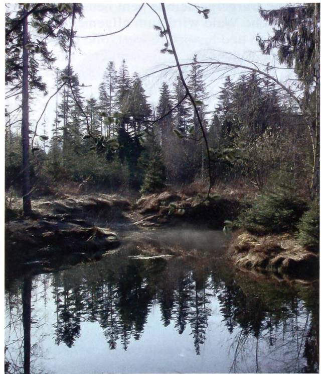
Im Hartlisbergwald unterhält die Burgergemeinde ein Nassbiotop (Teich) als stille Waldoase.

Strasse Bern–Thun, dem Weg ins Oberemmental über den Schallenberg (1895) und der Emental-Burgdorf-Thun-Bahn (1899), nun BLS, mit zwei Stationen (Steffisburg und Schwäbis) sowie der Trambahn Steffisburg–Thun–Interlaken, STI (1913), ab 1956 durch Buslinien ersetzt. Von Mitte des 19. Jh. an gab es hier erste Pendler, die in den eidg. Betrieben in Thun arbeiteten. Mit den grossen Bauphasen (1900, 1945, 1980, 2000) änderte sich die Beschäftigungs- und Siedlungsstruktur des Orts. Heute gibt es noch einzelne Bauernbetriebe; die Bevölkerung arbeitet im Gewerbe, in der Industrie und im Dienstleistungsbereich. In der Ebene sind neue Wohngebiete mit Quartieren angrenzender Gemeinden zusammengewachsen, so Schwäbis und Glockenthal-Hübeli mit Thun und Kaliforni mit Heimberg. Das in Industriezonen angesiedelte Gewerbe umfasst renommierte Maschinenfabriken sowie den aus der Pferderegianstalt (1850) im Schwäbis hervorgegangenen Armeemotorfahrzeugpark. In