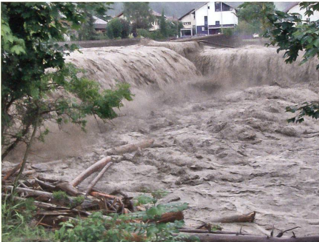
Die 1907–1909 gemauerte Müllerschwelle in Steffisburg beim Hochwasser 2012.

Die Zulg, die bei Unwetter zum tobenden Strom anschwillt, hat vorzeiten die Steffisburger Ebene mit ihrem Geschiebe aufgefüllt. Dieses Wildwasser und der daraus abgeleitete Mülibach haben ebenfalls den Dorfcharakter geprägt. Über Jahrhunderte hat die Zulg immer wieder die sog. «Müllerschwelle» zerstört und den Mülibach verstopft. Um das Geschiebe zurückzuhalten, wurden 1809/1810 in der Zulgschlucht zwei Querschwellen gebaut, wovon eine bald weggerissen wurde. 1810 besichtigte auch Hans Konrad Escher von Zürich, später Escher von der Linth genannt, die Schwellen der Zulg. Sein Gutachten dazu ist nicht mehr vorhanden. Von Zeit zu Zeit jedoch wird die Zulg wieder zum tosenden Strom, wenn im Eriztal ein Gewitter niedergegangen ist. Die ganze Baumstämme mitführende Zulg wird dann innert Minuten zum reissenden Fluss, der mit einer mächtigen Flutwelle («Aschwall») voran durch das Dorf donnert. Eine Brücke