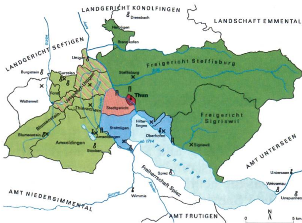
Karte 3: Die bernische Landesverwaltung in der Region Thun des Ancien Régime: Die Stadt Thun und die Ämter Thun und Oberhofen