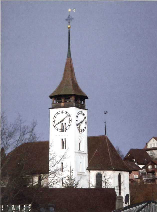
Die Dorfkirche mit romanischem Glockenturm ruht auf alten Fundamenten von Vorgängerbauten aus dem 7./8. und 10./11. Jh..

poriert. Mit der Reformation 1528 kamen Kirche und Kirchengut an Bern bis zur Abtretung 1885 an die Kirchgemeinde. Die heutige Kirche ist ein frühbarocker Saalbau mit polygonaler Chorzone; sie wurde 1681 vom Berner Münsterbaumeister Abraham Dünz I. erbaut. Die Süd- und Westwände der Kirche bestehen z.T. aus Originalmauern der frühromanischen Basilika; das 1000-jährige Mauerwerk der Südfassade ist eine architektonische Kostbarkeit und der aus dem 12. Jh. stammende romanische Turm das älteste Baudenkmal der Gemeinde. Steffisburg war Zentrum einer grossen «Kirchhöri» (ref. Kirchgemeinde) mit den Gemeinden Steffisburg, Fahrni, Unter- und Oberlangenegg, Eriz, Homberg, Buchen, Horrenbach; auch Heimberg gehörte von 1536 bis 1988 dazu. Heute umfasst die Kirchgemeinde