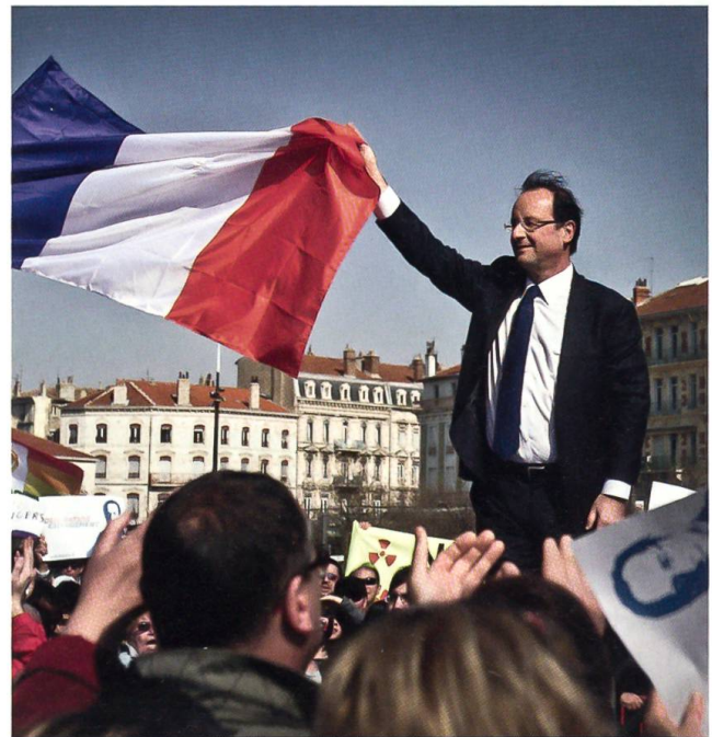
François Hollande, der zweite sozialistische Präsident Frankreichs

Am 6. Mai gewinnt François Hollande den entscheidenden zweiten Wahlgang gegen Nicolas Sarkozy, den bisherigen Präsidenten von Frankreich. François Hollande vereinigte 51,6% der Stimmen auf sich. Er ist erst der zweite Sozialist, der mit der Führung der Republik betraut wird. – Im Juni folgten die Stichentscheide der Parlamentswahlen. Dabei erringen die Sozialisten von François Hollande die absolute Mehrheit. Die konservative UMP (Union pour un mouvement populaire) des Vorgängers Nicolas Sarkozy verliert deutlich. Erstmals seit 1997 zieht der rechtsextreme Front National wieder ins Parlament. Das erste Jahr der Präsidentschaft von François Hollande stand unter einem ungunstigen Stern. Innenpolitisch gelangen ihm keine Erfolge. Er musste im Gegenteil viele Misserfolge verkraften. Die Arbeitslosigkeit verharrte auf einem Höchststand, ja stieg weiter. Französische Produkte wurden nicht mehr gefragt oder waren schlicht zu teuer gegenüber der Konkurrenz. François Hollande verschrub sich dem Kampf gegen die Steuerhinterziehung und musste selbst auf diesem Feld eine herbe Niederlage einstecken. Sein Budgetminister Jérôme Cahuzac wurde der Steuerhinterziehung überführt und musste zurücktreten. All diese Probleme führten dazu, dass seine Popularität nach dem ersten Jahr bei seinen Landsleuten auf 32% Zustimmung absanken.