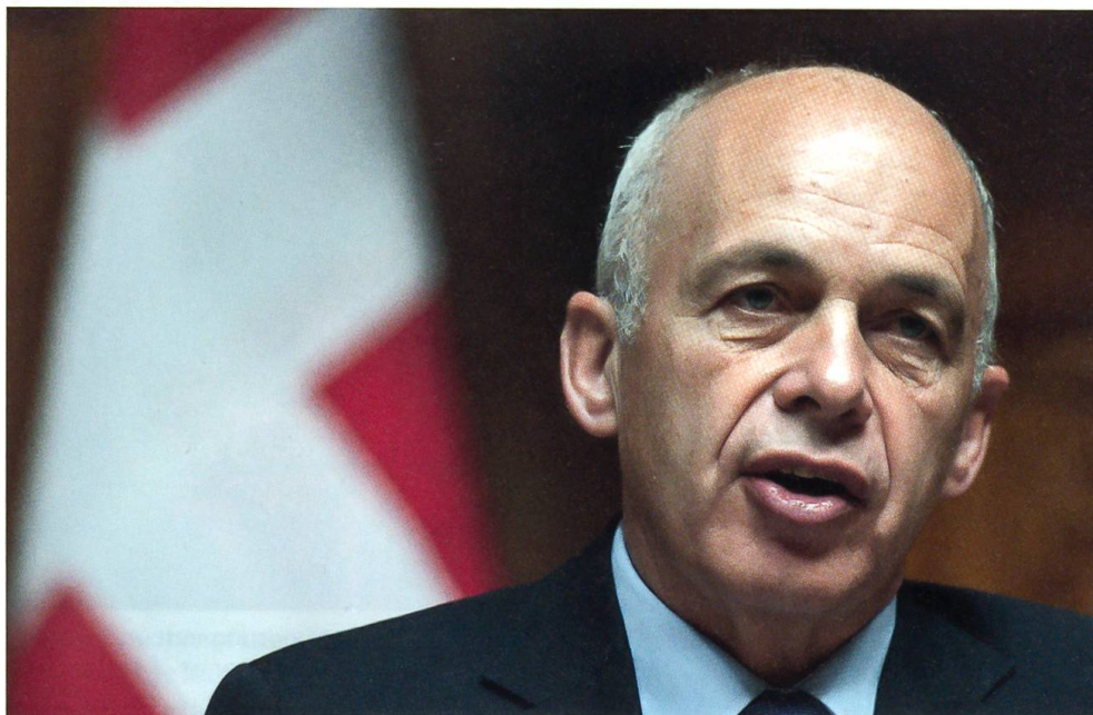
Ueli Maurer, Bundespräsident für das Jahr 2013

neuen Postgesetzgebung. Sie verläuft identisch zur Umwandlung von Swisscom, Skyguide, SBB und Ruag. Der Bund bleibt im Besitz sämtlicher Aktien.