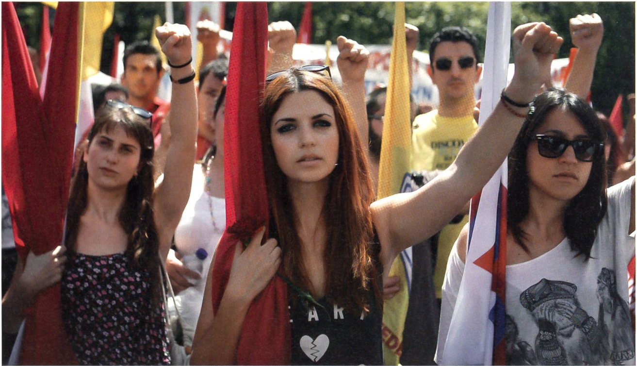
Die hohe Arbeitslosigkeit in den südlichen Ländern Europas treibt die Menschen auf die Strasse.