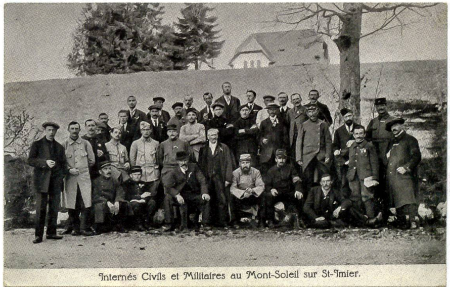
Sobald die Zivil- und Militärinternierten auf dem Sonnenberg angekommen waren, fotografierte man sie und machte aus dem Bild eine Postkarte. Die Soldaten tragen eine Uniform, die Zivilmänner einen Anzug.

Marianne Walle, «Les prisonniers français internés en Suisse 1916-1919», La Suisse et la guerre de 1914-1918. Actes du colloque tenu du 10 au 12 septembre 2014 au Château de Penthes, ss la dir. de Ch. Vuilleumier, Genève; Editions Slatkine, 2015, p. 151-173.