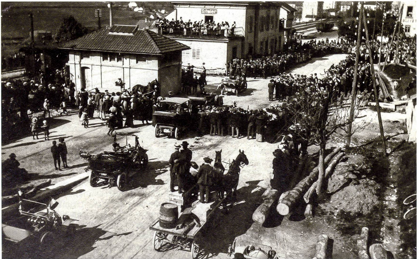
Der begeisterte Empfang der Internierten am 17. Mai 1916 in Saint-Imier (Mémoires d'Ici, Fonds Flotron)

stellt. Die Leute drängen sich auf den Strassen zusammen, sie stellen sich auf die Böschungen und die Dächer, um besser zu sehen. Als der Schnellzug um 8.39 Uhr in den Bahnhof einfährt, spielt das lokale Musikkorps die Marseillaise. Zwanzig Fahnen sind über dem Bahnsteig aufgehängt. Kinder tragen riesige blau-weiss-rote Blumensträusse. Überall ruft man «Vive la France!». Die Internierten antworten mit «Vive la Suisse!». Der Empfang ist so grandios, dass der Pressekorrespondent in der Abendausgabe von «Le Jura bernois»