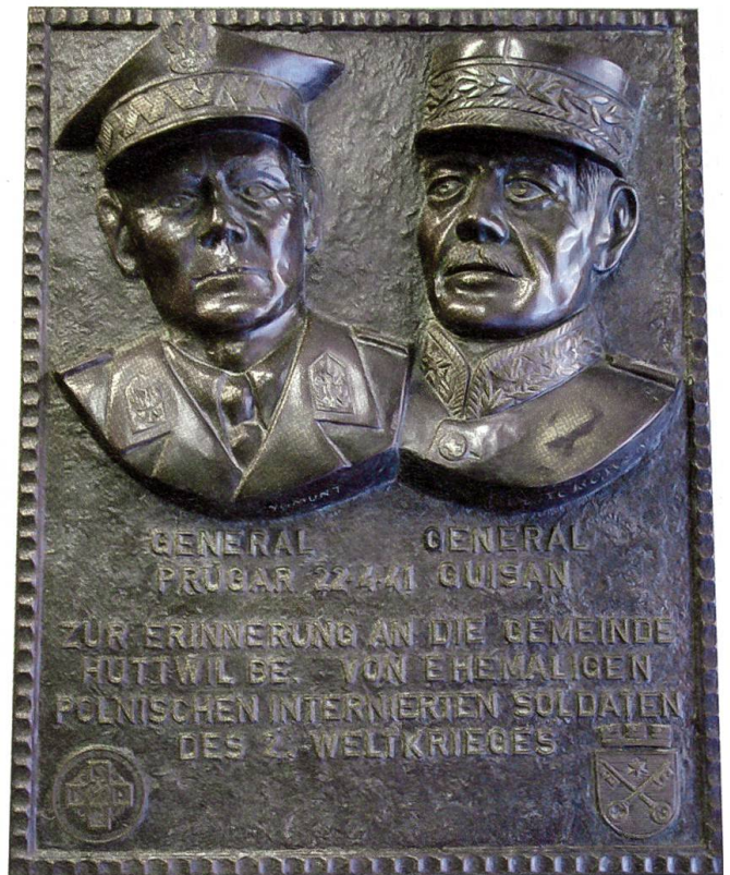
Diese Tafel erinnert in Huttwil an das Treffen der Generäle Prugar und Guisan.

In Rohrbachgraben mussten die Schüler bis im Oktober 1940 im Vereinshaus in Ganzenberg zur Schule, weil das Schulhaus mit Internierten belegt war. In Leimiswil wurde ein grosser Teil der Polen vorerst in Tennen von Bauernhäusern untergebracht. In Wasen wurden 14 Kantonemente eingerichtet, zu denen Löchlibad, Hornbachpinte, Kurzeneipintli, Lüderenalp und Kuttelbad gehörten.