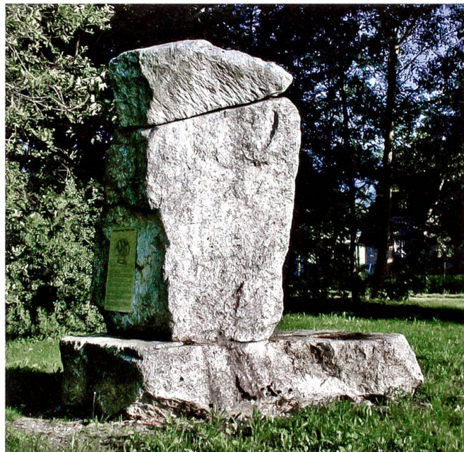
Dieser Findling erinnert an das Interniertenlager im Häftli bei Büren a. d. A.

Nur zwei Tage, nachdem das «grosse Werk» im Beisein von viel Prominenz in den Weihnachtstagen 1940 eingeweiht worden war, kam es zu einem Aufstand der Internierten. Wachtpersonal schoss auf Internierte, ein Pole wurde am Hals getroffen, einem anderen musste später ein Bein amputiert werden. Ende 1941 mussten auch die militärisch Verantwortlichen «die schwere Fehlbildung zugestehen, die das auf falscher psychologischer Basis und fehlerhafter Einschätzung der Betriebsschwierigkeiten entstandene Riesenlager darstellte». Das