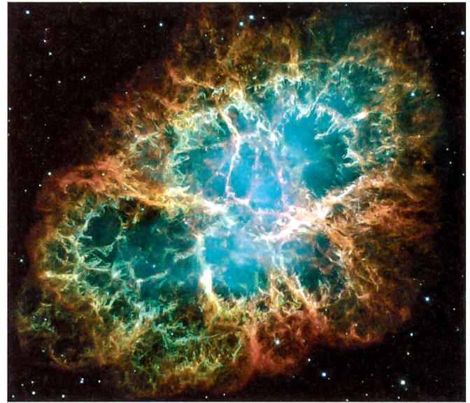
Der heute etwa 11 Lichtjahre grosse Überrest der Supernova vom 11. April 1054, genannt M1 im Sternbild des Stiers

serstoff und Helium vorhanden, wie nach dem Entstehen des Universums, sondern alle natürlich vorkommenden Elemente, inklusive des Goldes. Die Zeit vergeht, und in diesen Wolken ballt sich neuerlich die Materie zusammen und formt neue Sterne. Und oft bilden sich direkt neben den Sternen auch Planeten. So muss es gewesen sein, als sich vor viereinhalb Milliarden Jahren die Sonne gebildet hat. Und neben ihr entstand die Erde – der Ort, an dem wir leben, und der Ort, wo wir heute das Gold aus der Erde hervorklauben und es zu wunderschönen Dingen wie Schmuck oder einem Ehering verarbeiten: Gold, entstanden in einer Sternexplosion.