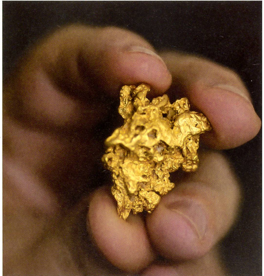
Ein Goldnugget in der Hand. Wer hätte es nicht gerne selber gefunden!

Man stelle es sich einmal so vor: 83 200 Barren, ein jeder gut zwölfeinhalb Kilogramm schwer und schlanke 25 Zentimeter lang. Herausgetragen aus den geheimnisumwitterten Tresoren der Nationalbank und direkt davor auf dem Berner Bundesplatz gestapelt, ergäbe diese Menge einen Turm von fast dreieinhalb Kilometer Höhe. Dessen zugegebenermassen doch sehr wacklige Turmspitze stünde nun Auge in Auge mit der schneebedeckten Spitze des 4042 Meter hohen Lauteraarhorns. Wahrlich, ein beeindruckend hoher Turm liesse sich also aufrichten, wenn die gesamten 1040 Tonnen Gold, die die Schweiz besitzt, zu dessen Bau verwendet würden. Bekäme jeder Schweizer und jede Schweizerin beim Abbau dieses Turmes seinen gleichen Anteil von knapp 167 Gramm an Gold, so entspräche dies der Goldmenge, die in 28 20-Franken-Goldvreneli enthalten ist.