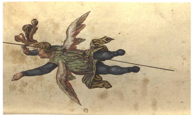
Konstruktionsanleitung für ein Schnurfeuerwerk mit fliegendem Engel aus einer Feuerwerkerhandschrift von 1610 (Burgerbibliothek Bern, Cod. 7, fol. 198v).

der Pulverzubereitung und der Herstellung der Geschütze bis zur Vorbereitung und Durchführung der Einsätze bei Belagerungen und Feldschlachten beherrschten. Um ihre Kenntnisse zu erweitern und vor allem um auch ausserhalb der Dienstzeiten der im Milizsystem organisierten Artillerie in Übung zu bleiben, schlossen sich die bernischen Artillerieoffiziere 1664 zu einem Kollegium zusammen. Neben der Geselligkeit wurden dort mathematische Studien betrieben, im eigenen Laboratorium erprobte man die Pulverherstellung und das Laden von Sprengkörpern, neue Geschütze mussten eingeschossen und das Zielschiessen eingeübt werden. Als Spezialisten waren die Büchsenmeister aber auch für den zivilen Einsatz der Pyrotechnik, den Einsatz «zu Lust und Schimpf» (d. h. Unterhaltung) verantwortlich. Das Berner Artilleriekollegium veranstaltete deshalb im obrigkeitlichen Auftrag bei entsprechenden Gelegenheiten auch Feuerwerke. So fand am 26. August 1728 beim damaligen Berner Zeughaus ein grosses «Lust-Feur-