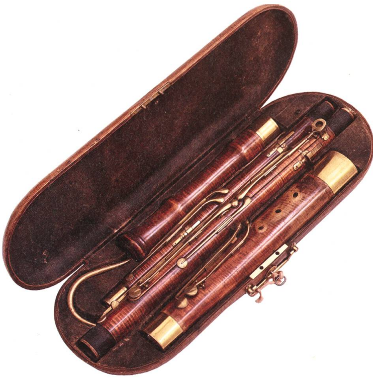
Fagott von Savary le jeune, Paris, datiert 1825, im Originalkoffer. Das Instrument erhielt Burri vom Musikalienhändler Krompholz, dessen Urgrossvater nicht nur das Geschäft in Bern gegründet, sondern im Berner Stadtorchester dieses Fagott gespielt hatte.

höchst innovatives Segment. Viele Musikerinnen und Musiker lernen historische Formen ihres Instruments zu spielen, Pianisten befassen sich mit dem Hammerflügel, Streicherinnen spielen wieder auf Darmsaiten und mit historischen Bögen und Paukisten mit originalen Fellen und Schlägeln.